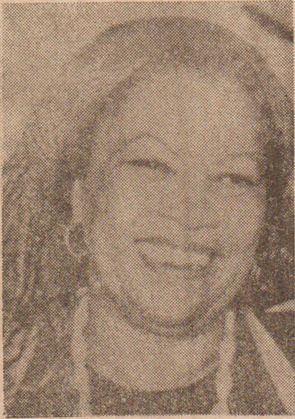
இலக்கியத்தில் ரொனியின் வேலையைக் குறிப்பாக உணர்த்துவது என்று கொள்ளலாம்.

இந்தச் சொற்களை, ரொனியின் தனிப்பட்ட தத்துவம் என்று எடுத்துக் கொள்ள முடியாவிட்டாலும் உலக