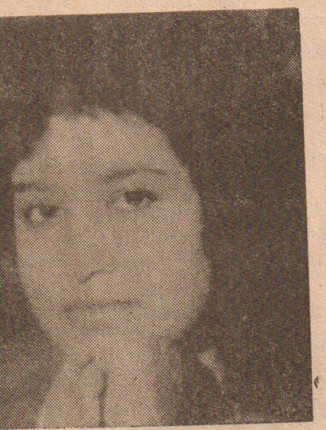
நஸ்ரீன் சமூகத்தில் தன் கருத்துக்களை நெஞ்சு நிமிர்த்தி சொல்லி அசாத்திய துணிச்சலுடன் வாழ்க்கை நடத்துவதற்காகவாவது இந்த எழுத்தாளரை எத்தனை பாராட்டினாலும் தரும்.

பெண்களும் புரட்சிகர சிந்தனைகளும் மூலையில் முடங்கிக் கிடக்க வேண்டும் என்று கருதுகின்ற ஒரு