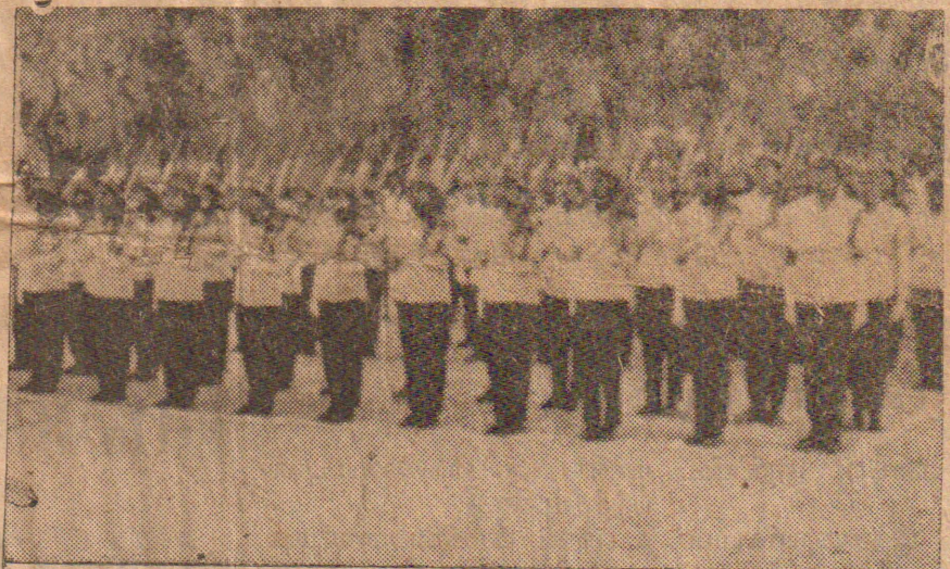
1991-06-01 அன்று தமிழீழக் காவற்றுறையின் பெண்-ஆண் உறுப்பினர்கள் தமது பயிற்சியை ஆரம்பித்தனர்.

தமிழீழத் தேசியத் தலைவர் திரு. வே. பிரபாகரன் அவர்கள் 1991-11-19 அன்று, தமிழீழக் காவல் துறையினரின் அணிவகுப்பு மரியாதையை ஏற்றுக்கொண்டு, அவர்களின் செயற்பாடுகளை அதிகாரபூர்வமாக ஆரம்பித்துவைத்தார்.