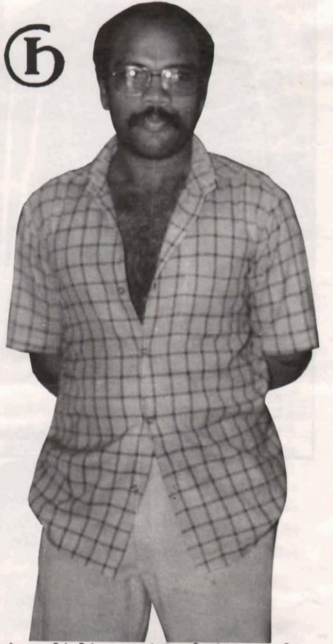
நான் குறிப்பிட்ட இஸ்ரேலியத் தளபதி, போர்க்களத்தின் பின்னே நின்று கட்டளையிட்டதில்லை. அவர் எப்பொழுதும் களத்தில் முன்னணி வகித்து, முன்னேறுங்கள், முன்னேறுங்கள்; என்னைப் பின் தொடருங்கள்; என்று முழங்கியதாகப் படித்தேன். தான் பின்னால் நின்றுகொண்டு, தனது படைகளை முன்னேறுங்கள் என்று கூறியதே கிடையாது.