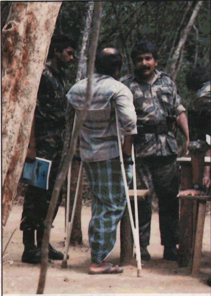
"தேசியத் தலைவரின் துணைவன்"