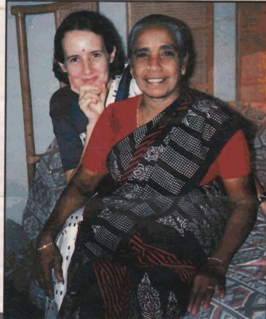
'புலி கிடந்த குகை' எனத் தன் வயிற்றைச் சுட்டிக்காட்டி மகனின் வீரத்தை விளக்கினாள் சங்கத்து வீரத்தாய் - உதாரணமாய் கிட்டம்மா.

ஒவ்வொரு முறையும் அவர்கள் தம் பயணத்தைத் தொடரும்போதும், நாம் எப்போதும் கரையிலிருந்து கைவீசி வாழ்த்தி அனுப்புவோம். அது மட்டும்தான் எங்களால் முடியும் பரந்த கடலிலே அவர்கள் கரைந்தபோது எம்மால் அதை உணர முடிந்ததே தவிர உதவ முடியவில்லை. அவர்கள் எரிவதைக் கண்டோம்; எம் கண்களாலேயே பார்த்தோம், பார்த்துக்கொண்டே இருந்தோம், நாம் பார்த்துக் கொண்டிருக்க அவர்கள் எரிந்து கொண்டே இருந்தார்கள்.