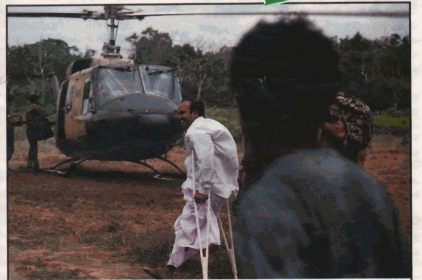
கொழும்புக்கு நல்லெண்ண விஜயம்

என் மகனே! எங்கு சென்றாய். வீரத்தின் விளை நிலமே வீரகாவியங்கள் படைத்த உன் தினவெடுத்த தோள்கள் சரிந்தனவோ! அலைபோன்ற மக்களின் அன்பினில் திளைத்தவனே! அலைகடல் நடுவே எரிமலையாய் வெடித்தாய் அன்னை என் மானத்தை காத்தாய் என் மகனே! நீ நிச்சயம் மீண்டும்..... மீண்டும் எழுந்து வருவாயடா - என் அடிமை விலங்கொடிப்பாயடா!