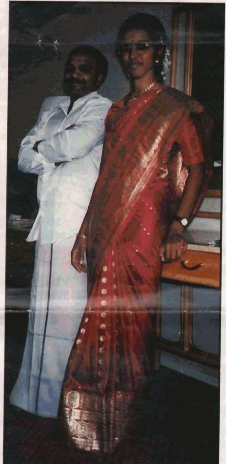
தேசத் தளபதி குடும்பத் தலைவியுடன்