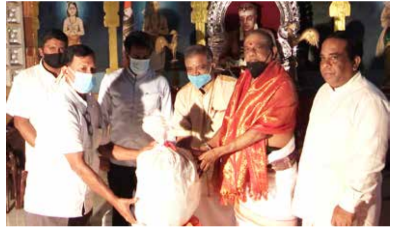
திட்டம் ஆரம்பித்து வைக்கப்பட்டுள்ளது

ஆறுமுக நாவலரின் 200ஆவது ஆண்டு விழாவை முன்னிட்டு - முக்கியமாக 192ஆவது குருபூசை தினத்தை முன்னிட்டு நாவலர் பிறந்த மண்ணில் இலங்கை பிரதமரின் அவர்களின் அறிவுறுத்தலுக்கு அமைய நாடு பூராகவும் அறநெறிப் பாடசாலைகளில் 100 பாடசாலைகள் தெரிவு செய்யப்பட்டு நூலகம் அமைக்கும்