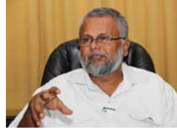
துரையாடல் நடத்தி இதனை இன்று திங்கட்கிழமை முதலே நடைமுறைப்படுத்துமாறும் அவர் மேலும் பணிப்புரை விடுத்தார். (ஐ)

இந்தக் கலந்துரையாடலில் கலந்துகொண்டிருந்த பிரதிப் பொலிஸ்மா அதிபர் மற்றும் மாவட்ட இராணுவத் தளபதி ஆகியோருடன், மாவட்ட செயலாளருடன் உடனடியாக கலந்திருக்காமல் பரந்தன் சந்தி முதல், முற்கண்டி வரையில் ஏ9 வீதியில் பொலிஸாரும், இராணுவத்தினரும் இணைந்து வீதிப் போக்குவரத்து விதிமுறைகளை கடுமையாக நடைமுறைப்படுத்தவேண்டும் என்று அறிவுறுத்தினார்.