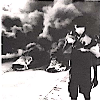
பொதுமக்களின் போராட்டம் தீவிரமடைந்துள்ளது. இதனால் கலவரத்தில் ஈடுபட்டவர்களை ஒடுக்க இரானுவத்தினர் பல்வேறு இடங்களிலும் துப்பாக்கிப் பிரயோகம் நடத்தினார்கள். இதில் 18 பேர் உயிரிழந்தனர். மேலும் பலர் படுகாயமடைந்துள்ளனர். (ம)

சூடான் தலைநகர் கார்டும் உள்ளிட்ட கசாலா, டோங்கோலா, வாப்படானி, ஷெனிளா ஆகிய முக்கிய நகரங்களில் அந்த நாட்டின் இரானுவத்துக்கு எதிராகக் கலவரம் வெடித்துள்ளது. அங்கு அண்மையில் இரானுவ ஆட்சி அறிவிக்கப்பட்டிருந்த நிலையில் அந்த மக்கள் போர் வெடித்துள்ளது.