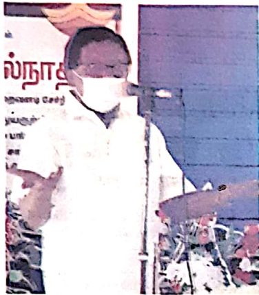
உதயன் குழுத் தலைவரும் நாடாளுமன்ற உறுப்பினருமான ஈ. சுவாமிபவன்