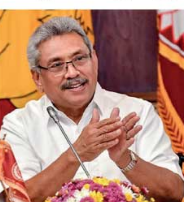
அதிகாரிகளுக்கு, ஜனாதிபதி கோட்டாபய ராஜபக்ஷ

கொரோனா வைரஸ் தொற்றுக்கு எதிரான இரண்டாவது டோஸ் தடுப்பூசியை ஏற்றி மூன்று மாதங்கள் கடந்த 60 வயதுக்கு மேற்பட்ட அனைவருக்கும், நடமாடும் சேவையின் ஊடாக, மூன்றாவது டோஸாக பூஸ்டர் (Booster) தடுப்பூசியை ஏற்ற நடவடிக்கை எடுக்குமாறு, சுகாதாரத்துறை