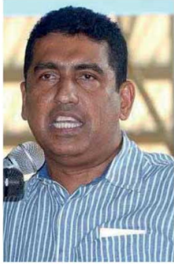
அனைத்தையும் ஆராய்ந்தே செய்தி வெளியிட வேண்டும் என்று கேட்டுக்கொள்கிறேன் அமைச்சர் ஜோன்ஸ்டன் பெர்ணான்டோ தெரிவித்தார்.

எதிர்க்கட்சிகள் சொல்பவையெல்லாம் ஊடகங்களில் வெளிவந்தால் மக்கள் கொந்தளிப்பார்கள். எரிபொருள் தட்டுப்பாடு ஏற்படும் என கூறிய விவகாரத்திலும் இதுவே நடந்தது எனவும் அமைச்சர் ஜோன்ஸ்டன் பெர்ணான்டோ தெரிவித்தார். தற்போதைய அரசாங்கம் ஊடகங்களுடன் மோதும் அரசாங்கம் அல்ல. ஊடகங்கள்