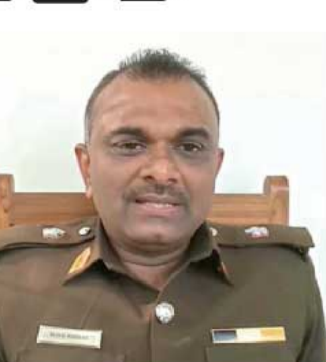
தொடர்பில் ஊடகங்களுக்கு கருத்துத் தெரிவிக்கையில்,