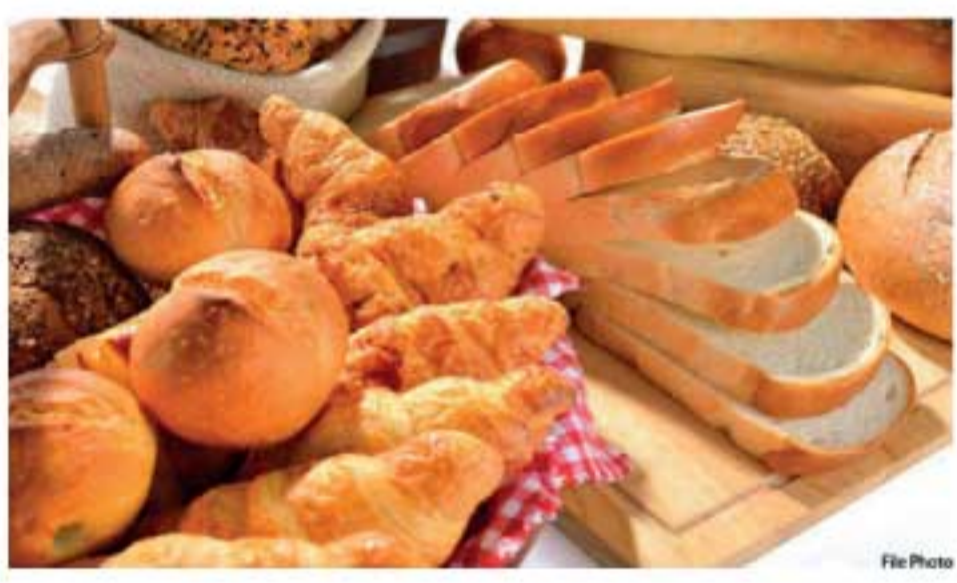
தீர்மானிக்கப்பட்டுள்ளதாக உணவக உரிமையாளர்கள் சங்கம் தெரிவித்தது.

பாண், கொகூத்து ரொட்டி, சிறுநுண்ணடிகள் (ஷோர்ட் ஈட்ஸ்) விலைகளையும் அதிகரிக்க தீர்மானிக்கப்பட்டுள்ளதாக உணவக உரிமையாளர்கள் சங்கம் தெரிவித்தது. நேற்று (28) நள்ளிரவு முதல் அமலாகும் வகையில், பாணின் விலை அதிகரிக்கப்பட உள்ளதாக அகில இலங்கை பேக்கரி உரிமையாளர்கள் சங்கம் தெரிவித்துள்ளதுடன், கொகூத்து ரொட்டி மற்றும் சிறுநுண்ணடிகளின் விலைகளை இன்று (29) முதல் அதிகரிக்க