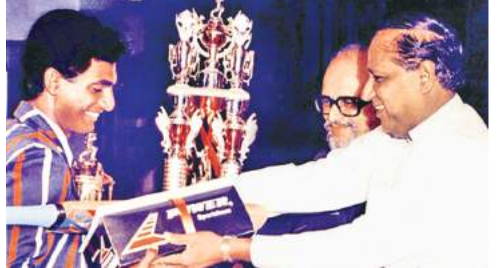
வாழ்த்து சென்றவை சேர்ந்த நெத்மி பூர்ணா ஆகியோர் முறையே இரண்டாவது மற்றும் மூன்றாவது இடங்களைப் பெற்றனர். அந்த இடம் வாய்விடும், முரளிதரன் பாடசாலை கிரிக்கெட்டில் மிகவும் கெற்றிகரமான பந்துவீச்சாளராக இருந்தார். அவர் 1991

43வது ஓப்சர்வரர் SLT மொபிடெல் பாடசாலை கிரிக்கெட்டில் ஓஃப் தி இயர் ஆண்டு மொகா ஷோவை அடுத்த மாத நடுப்பு குதியில் நடத்துவதற்கான தற்காலிக ஏற்பாடுகள் செய்யப்பட்டுள்ளன. இருப்பினும், இது சுகாதார அதிகாரிகளின் இறுதி அனுமதி மற்றும் கொவிட்-19 வழிகாட்டுதல்களுக்கு உட்பட்டது. சண்டே ஓப்சர்வரர் மற்றும் SLT மொபிடெல் உண்மையான பெருநிறுவன குடிமக்களாக பாடசாலை கிரிக்கெட்டுக்கு அதன் தொர்ச்சியான ஆதரவைக் காட்டுவதன் மூலம், ஆண்டின் ObserverSLT மொபிடெல் பாடசாலை கிரிக்கெட்டர்களை இடையூறு இல்லாமல் நடத்த முடிந்தது. இது போன்ற நிகழ்வுகள் உட்பட்ட அனைத்து விளையாட்டு நடவடிக்கைகளும் ஸ்தம்பிதமடைந்தன. பாடசாலை கிரிக்கெட் நிர்வாகக் குழுவான SLSCA கூட கடந்த இரண்டு வருடங்களாக ஆண்டு விருது வழங்கும் விழாவை நடத்த முடியவில்லை. அதுவும் 43 ஆண்டுகளுக்கு முன்பு ஓப்சர்வரர் பாடசாலை கிரிக்கெட்டில் ஓஃப் தி இயர் தொடங்கியது, பாடசாலை கிரிக்கெட்டுக்கான SLSCA அவர்களின் சொந்த விருது வழங்கும் விழா தொடங்குவதற்கு நீண்ட காலத்திற்கு முன்பே.