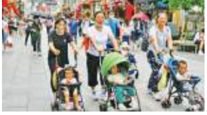
ஆண்டின் ஆரம்பத்தில் அந்த எண்ணிக்கை 3ஆக அதிகரிக்கப்பட்டது. எனினும், கொள்கை மாற்றங்கள் பயனளிக்கவில்லை. அதிகரிக்கும் வாழ்க்கைச் செலவுகள், கருத்தரிப்பு குறித்து அதிகமான பெண்கள் சுயமாக முடிவெடுப்பதும் அதற்குக் காரணங்களாக இருக்கலாம் என்று கூறப்படுகிறது.

சீனாவின் குழந்தைப் பிறப்பு வீதம், கடந்த ஆண்டு வரலாறு காணாத அளவு சரிந்ததாகத் தெரிவிக்கப்பட்டுள்ளது. 2020இல் ஒவ்வொரு 1,000 பேருக்கும் 8.52 குழந்தைகள் பிறந்ததாகச் சென்ற வாரம் வெளியான 2021 புள்ளிவிபரப் புத்தகத்தில் குறிப்பிடப்பட்டிருந்தது. 1978ஆம் ஆண்டு அந்தப் புள்ளிவிபரங்களைச் சேகரிக்க ஆரம்பித்ததில் இருந்து பதிவாகிய மிகக் குறைவான எண்ணிக்கை இதுவாகும். குழந்தைப் பிறப்பு வீதத்தை உயர்த்துவதற்காக 2016ஆம் ஆண்டு, சீனாவின் 'ஒரே குழந்தை' கொள்கையில் மாற்றங்கள் செய்யப்பட்டன. தம்பதிகள் 2 குழந்தைகள் வரை பெற்றுக்கொள்ளலாம் என அறிவிக்கப்பட்டது. இந்த