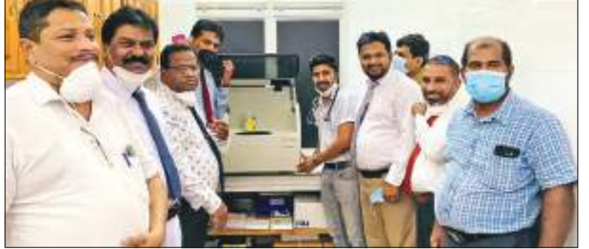
பாலமுனை விசேட நிருபர்

பொத்துவில் ஆதார வைத்தியசாலையின் மருத்துவ ஆய்வுகூடத்திற்கு குருதிப் பரிசோதனைகளை மேற்கொள்வதற்காக சுமார் மூன்று மில்லியன் ரூபா பெறுமதியான உயிரியல் இரசாயனப் பகுப்பாய்வு