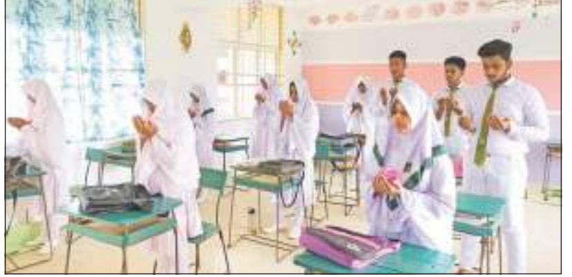
கிண்ணியா மத்திய நிருபர்

கிண்ணியா குறிஞ்சாக்கேணி ஆற்றில் நேற்று முன்தினம் (23) படகு கவிழ்ந்து பரிதாபமாக உயிரிழந்த மாணவர்களின் ஈடுதீர்த்துக்காக வேண்டி, கிண்ணியாவில் உள்ள அனைத்து பாடசாலைகளிலும் மாணவர்கள் விசேட துஆப் பிரார்த்தனையில் ஈடுபட்டனர். கிண்ணியா வலயக் கல்வி அலுவலகத்தின் அறிவுறுத்தலுக்கு அமைய நேற்று (24) 66 பாடசாலைகளில் காலை ஆராதனையின் போது, இவ்வாறு விசேட துஆப் பிரார்த்தனையில் ஈடுபட்டனர்.