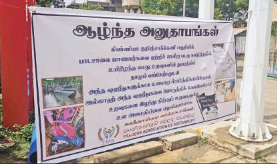
கிண்ணியா குறிஞ்சாக்கேணி படகு விபத்தில் உயிரிழந்தவர்களுக்கு அனுதாபம் தெரிவிக்கும் வகையில் காத்தான்குடியில் வெள்ளைக் கொடிகள் பறக்க விடப்பட்டுள்ளதடன் அனுதாபம் தெரிவிக்கும் பதாகைகளும் தொங்கவிடப்பட்டிருந்த போது...