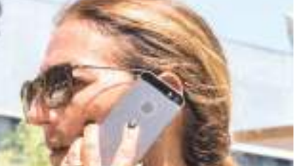
பயன்படுத்தப்பட்டதாக குற்றஞ்சாட்டப்படுகிறது. "ஆப்பிள் பயனர்களை இலக்கு வைத்து மற்றும் கண்காணித்ததற்கு என்.எஸ்.ஓ குழுமம் மற்றும் அதன் தாய் நிறுவனமான என்.எஸ்.ஓ, டெக்னோலஜிஸ் பொறுப்புக்கூறவேண்டும்" என்று ஆப்பிள் குறிப்பிட்டுள்ளது. கலிபோர்னியாவின் வடக்கு மாவட்டத்திற்கான மாவட்ட நீதிமன்றத்தில் அந்த நிறுவனம் தனது முறைப்பாட்டை பதிவுசெய்துள்ளது.

ஊடுருவல் கருவி ஒன்றினால் ஐபோன் பயனர்களை இலக்கு வைத்த குற்றச்சாட்டில் இஸ்ரேலிய உளவுநிலை நிறுவனமான என்.எஸ்.ஓ குழுமம் மற்றும் அதன் தாய் நிறுவனத்தின் மீது ஆப்பிள் நிறுவனம் வழக்குத் தொடுத்துள்ளது. என்.எஸ்.ஓவின் பெகசஸ் என்ற மென்பொருள் ஐபோன் மற்றும் அன்ட்ராயிட் சாதனங்களை பாதிக்கக் கூடியதாக இருப்பதோடு, அதில் இருக்கும் செய்திகள், படங்கள் மற்றும் மின்னஞ்சல்கள், தொலைபேசி அழைப்பு பதிவுகளை பிரித்தெடுக்கவும் ஒலிவாங்கிகள் மற்றும் கெமராகளை இரகசியமாக செயற்படுத்தவும் அனுமதிக்கிறது. எனினும் தமது கருவி பயங்கரவாதிகள் மற்றும் குற்றவாளிகளை இலக்கு வைத்து உருவாக்கப்பட்டது என்று என்.எஸ்.ஓ குழுமம் குறிப்பிட்டுள்ளது. ஆனால் இதனை செயற்பாட்டாளர்கள், அரசியல்வாதிகள் மற்றும் ஊடகவியலாளர்களுக்கு எதிராக