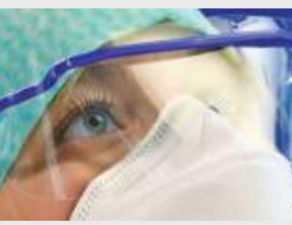
அமைப்பு எச்சரித்துள்ளது. ஐரோப்பாவில் நோய்த் தொற்று வேகமாக அதிகரிக்கும் நிலையில் ஆஸ்திரியாவில் மீண்டும் முடக்க நிலை கொண்டுவரப்பட்டுள்ளதோடு ஏனைய

கொவிட்-19 தொற்றினால் ஐரோப்பா மற்றும் ஆசியாவின் சில பகுதிகளில் எதிர்வரும் மார்ச் மாதத்திற்குள் மேலும் 700,000 பேர் உயிரிழக்கக் கூடும் என்று உலக சுகாதார அமைப்பு எச்சரித்துள்ளது. உலக சுகாதார அமைப்பு அதன் ஐரோப்பிய பிராந்தியமாக குறிப்பிடும் 53 நாடுகளில் ஏற்கனவே உயிரிழப்பு எண்ணிக்கை 1.5 மில்லியனைத் தாண்டியுள்ளது. இதில் 49 நாடுகளில் 2022 மார்ச் மாதத்திற்குள் அவசர சிகிச்சை பிரிவுகள் "அதிக அல்லது கடுமையான ஆழ்ததத்தை" எதிர்கொள்ளும் என்று அந்த