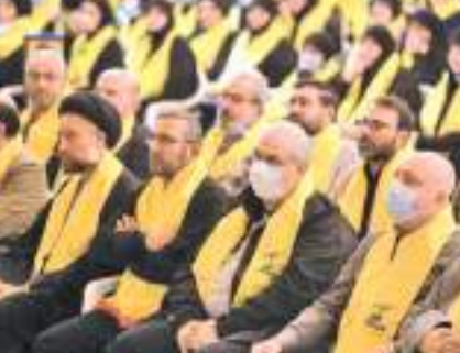
யுள்ளது. ஹிஸ்புல்லாவுக்கு ஆதரவான செயற்பாட்டில் ஈடுபட்டதாக லெபனானைத் தளமாகக் கொண்ட அல்-கர்த் அல்-ஹுசன் என்ற நிறுவனத்தை சஃது மியேயே இந்த அறிவிப்பு வெளியாகி

ஈரான் ஆதரவு லெபனானைத் தளமாகக் கொண்ட ஹிஸ்புல்லா அமைப்பை 'பயங்கரவாத' குழுமாக அவுஸ்திரேலியா அறிவித்துள்ளது. அந்த அமைப்பின் ஒட்டுமொத்த பிரிவுகளும் இதில் உள்ளடக்கப்படுவதால் அவுஸ்திரேலிய ஒளிபரப்புக் கூட்டுத்தாபனம் வெளியிட்ட செய்தியில் குறிப்பிடப்பட்டுள்ளது. ஹிஸ்புல்லா இராணுவ பிரிவுக்கு 2003 தொடக்கம் தடை உள்ளமை குறிப்பிடத்தக்கது. ஹிஸ்புல்லாவுக்கு எதிராக நடவடிக்கை எடுக்கும்படி அமெரிக்கா கடந்த மே மாதம் கோரி இருந்த நிலைமையே இந்த அறிவிப்பு வெளியாகி