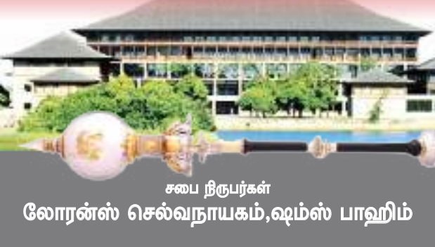
சபை நிருபர்கள் லோரன்ஸ் செல்வநாயகம், ஷம்ஸ் பாஹிம்