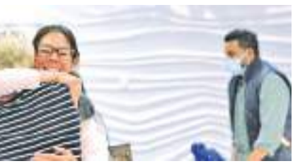
முழுமையாகத் தடுப்பூசி போட்டுக்கொண்ட பயணிகள் அங்கு செல்லலாம். நியூசிலாந்து செல்வோர் தனிமைப்படுத்திக்கொள்ளும் இடங்களில் தங்கத் தேவையில்லை. ஆனால் அவர்கள் 7 நாட்களுக்குச் சுயமாகத் தனிமைப்படுத்திக்கொள்ள வேண்டும். கொரோனா தொற்று பாதிப்பை அடுத்து நியூசிலாந்து கடந்த 2020 மார்ச் மாதம் தனது எல்லையை மூடியது. மேதம் தோற்றுக் காரணமாக ஆரம்பத்திலேயே எல்லைகளை மூடிய நாடுகளில் ஒன்றாக நியூசிலாந்து உள்ளது.

நியூசிலாந்து அதன் எல்லை களை சர்வதேச பயணிகளுக்குத் திறந்துவிடுவதற்கான திட்டங்களை வெளியிட்டுள்ளது. இதன்படி எல்லைகள் கட்டக் கட்டமாகத் திறக்கப்படும். அவுஸ்திரேலியாவிலிருந்து முழுமையாகத் தடுப்பூசி போட்டுக்கொண்ட நியூசிலாந்துக்கு குடிமக்களும் விசா அனுமதி வைத்திருப்போரும் வரும் ஜனவரி 16ஆம் திகதி முதல் நியூசிலாந்து செல்லலாம். வரும் பெப்ரவரி 13ஆம் திகதி மிகவும், மற்ற பெரும்பாலான நாடுகளிலிருந்து முழுமையாகத் தடுப்பூசி போட்டுக்கொண்ட நியூசிலாந்துக்கு குடிமக்களும் விசா அனுமதி வைத்திருப்போரும் நியூசிலாந்துக்குள் அனுமதிக்கப்படும். அடுத்து ஆண்டு ஏப்ரல் இறுதியிலிருந்து, எல்லா நாடுகளிலிருந்தும்