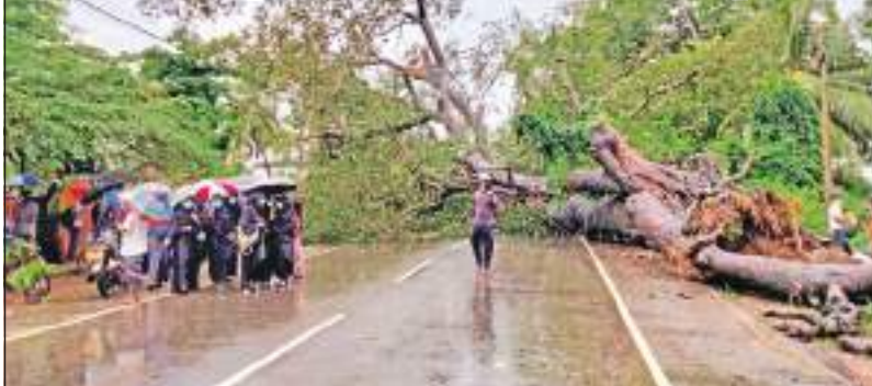
நிந்தவூர் குறுப் நிருபர்

நிந்தவூர் பிரதான வீதியில் அமைந்துள்ள ரசாக் ஹோட்டலுக்கு முன்னால் காணப்படும் பல நூறு வருடங்கள் பழமை வாய்ந்த ஆலமரம் நேற்று (24) காலை முறிந்து விழுந்ததால், காலை 7.30 மணி முதல் வாகன நெரிசல் ஏற்பட்டிருந்தது. அத்துடன், காலை முதல் நிந்தவூர் பிரதேசத்தில் மின்சாரம் தடைப்பட்டிருந்ததுடன் மாற்று உள் வீதிநிலாடான போக்குவரத்துக்கள் இடம்பெற்றன. இருந்தாலும்