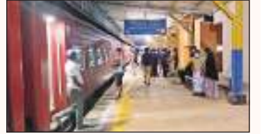
மட்டக்களப்பு குறாப் நிருபர்