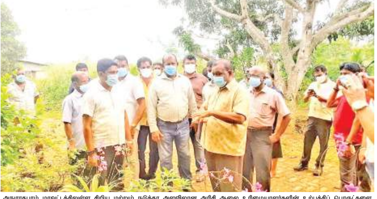
அனுராதபுரம் மாவட்டத்திலுள்ள சிறிய மற்றும் நடுத்தர அளவிலான அரிசி ஆலை உரிமையாளர்களின் உற்பத்திப் பொருட்களை விற்பனை செய்து நுகர்வோருக்கு அரிசியை பெற்றுக் கொடுக்கும் நோக்குடன் ஆரம்பிக்கப்பட்டுள்ள தம்பத்தேகம் அரிசி பொருளாதார மத்திய நிலையம் அமைக்கப்பட்டுள்ள இடத்தை காணி அமைச்சர் எஸ்.எம்.சந்திரசேன நேற்று (29) பார்வையிட்ட போது.

(புத்தளம் தினகரன் நிருபர்) மக்கள் விடுதலை முன்னணி (ஜே.வி.பி)யினால் மக்களுக்கு நாட்டு நிலைமை தொடர்பாக கத் தெளிவூட்டி தீர்வுகளையும் முன்மொழிவுகளையும் எடுத்துக் கொண்டு "ஊரிலிருந்து தொடங்குவோம்" என்ற தொனிப்பொருளில் நடத்தும் மக்கள் சந்திப்பு (27) சனிக்கிழமை புத்தளத்தில் இடம்பெற்றது. இம்மக்கள் சந்திப்புக்கு ஜேவிபி பொதுச் செயலாளர் டில்லின் சில்வா, தேசிய மக்கள் சந்தியின்