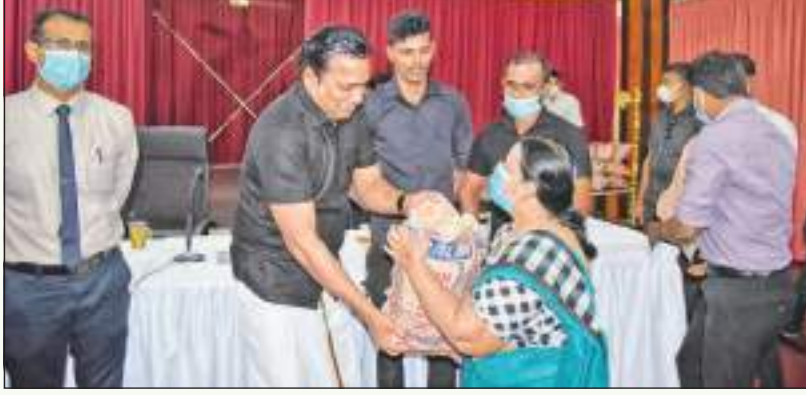
ணங்களில் உழுந்து மற்றும் பயறு பயிற்சி செய்கை திட்டத்தின் கீழ், குறித்த விதை பொதிகள் வழங்கி வைக்கப்பட்டன. இந்நிகழ்வின்போது, மண்முனை வடக்கு பிரதேச செயலக பிரிவிற் குட்ட 15 கிராம உத்தியோகத்தர் பிரிவுகளை சேர்ந்த 57 பயனாளர்களுக்கு இஞ்சி பொதிகள் வழங்கி வைக்கப்பட்டுள்ளதுடன்,