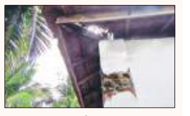
(கல்வடி குறாப் நிருபர்)

மட்டக்களப்பில் வீடு ஒன்றின் மீது மின்னல் தாக்கியதில் ஒரே குடும்பத்தைச் சேர்ந்த மூவர் தெய்வாஜீனமாக உயிர்தப்பியுள்ளனர். காத்தான்குடி பொலில் பிரி விற்குட்பட்ட ஆரையம்பதி தெற்கு கிராம உத்தியோகத்தர் பிரிவினுள்ள வீடொன்றிலேயே இடி, மின்னல் தாக்கிய சம்பவம் சனிக்கிழமை (27) நள்ளிரவு 1.00 மணியளவில் ஏற்பட்டுள்ளது.