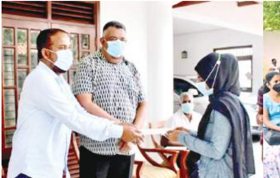
பொதுஜன பெருமுன பாராளுமன்ற உறுப்பினர் மர்ஜான் பரீவின் நிதியொதுக்கீட்டில் பேருவனை பிரதேசத்தைச் சேர்ந்த குறைந்த வருமானம் பெரும் குடும்பங்களுக்கு பல்வேறு தேவைகளை நிறைவேற்றுவதற்கு நிதியுதவிகள் வழங்கும் நிகழ்வு (28) பாராளுமன்ற உறுப்பினரின் பேருவனை இல்லத்தில் இடம்பெற்றது. இதன்போது பேருவனை நகர சபை உப தலைவர் முனவ்வர் றபாய்தீன் தாயொருவருக்கு நிதியுதவிக்கான காசோலையை வழங்குவதையும் அருகில் பாராளுமன்ற உறுப்பினர் மர்ஜான் பரீவின் மற்றும் நிதியுதவி பெற வந்தேறில் ஒருபகுதியினரையும் படங்களில் காணலாம்.