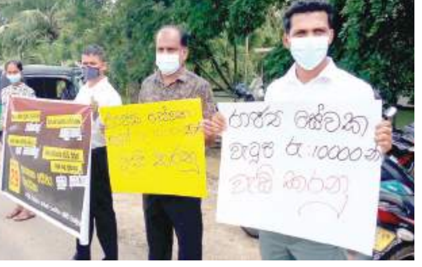
சம்பம் உயர்வு உட்பட பல்வேறு கோரிக்கைகளை முன்வைத்து புத்தளம் பிரதேச செயலகத்தில் கடமையாற்றும் ஊழியர்கள் நேற்று (29) பிரதேச செயலகத்துக்கு முன்பாக ஆர்ப்பாட்டத்தில் ஈடுபட்டதை படங்களில் காணலாம்.