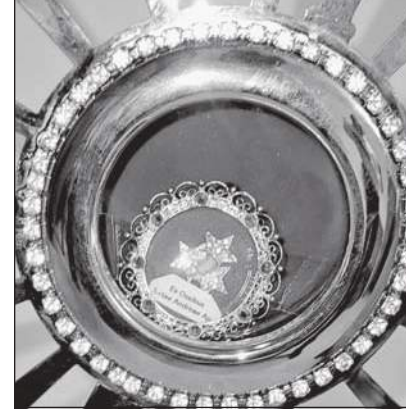
அடையாளம் காண முயற்சிக்க பின் தொடர்ந்து, நீயே மெசியாவா என்று கேட்டார். வந்து பார் என்கிறார் இயேசு. நாமும் அவரைப் போன்று இயேசுவைக் கண்டுபிடித்து