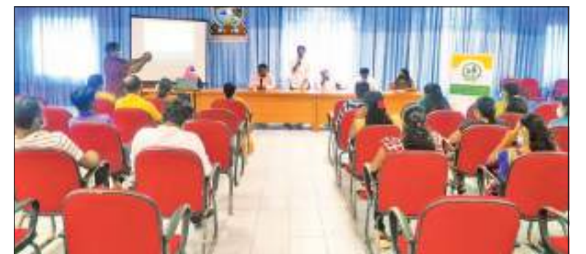
பணிப்பாளர் அசர் ஆசிரியர் அவர்களுக்கும் நன்றிகளை தெரிவித்துக் கொண்டார்.

இந் நிகழ்வின் பிரதேச சபைக்கு வழங்கிய ரெக்டோ நிறுவனத்தின்