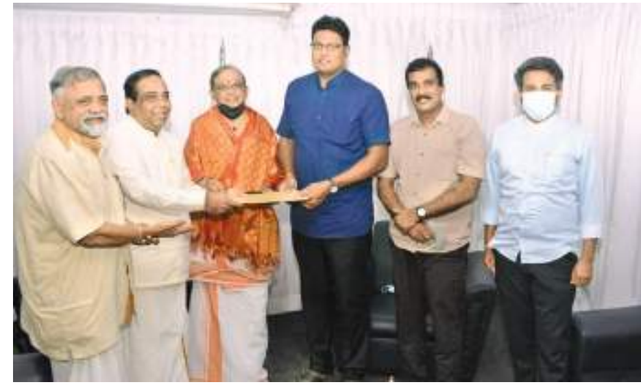
வாணொலி தென்றல் அலைவரிசையில் அறநெறிப் பாடசாலை மாணவர்களுக்காக இடம்

வித்தார். இது இவ்விதமிருக்க, மூலமூர் ஆறுமுகநாவலர் பெருமான் 200 ஆவது ஜனநினைவை முன்னிட்டு இந்து சமய, கலாசார அலுவல்கள் திணைக்களம் களத்திற்குச் சொந்தமான நாவலர் கலாசார மண்டபத்தில் நாவலர் பணிகளை யாழ்.மாநகர சபையோடு இணைந்து செயற்படுத்தும் வகையில் சுமுகமான முறையிலே இடம்பெற்ற இச்சந்திப்பு நிகழ்விலே பிரதமரின் இந்து மத விவகாரங்களுக்கான