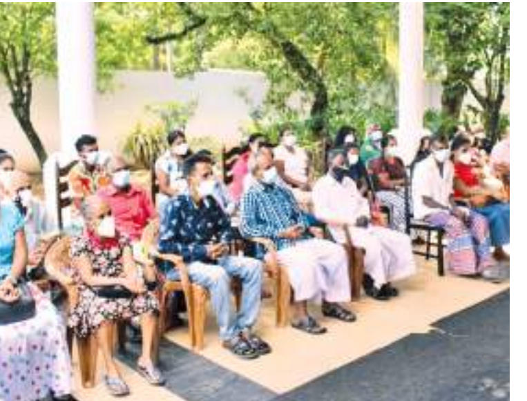
பொதுஜன பெருமுன பாராளுமன்ற உறுப்பினர் மர்ஜான் பரீவின் நிதியொதுக்கீட்டில் பேருவனை பிரதேசத்தைச் சேர்ந்த குறைந்த வருமானம் பெரும் குடும்பங்களுக்கு பல்வேறு தேவைகளை நிறைவேற்றுவதற்கு நிதியுதவிகள் வழங்கும் நிகழ்வு (28) பாராளுமன்ற உறுப்பினரின் பேருவனை இல்லத்தில் இடம்பெற்றது. இதன்போது பேருவனை நகர சபை உப தலைவர் முனவ்வர் றபாய்தீன் தாயொருவருக்கு நிதியுதவிக்கான காசோலையை வழங்குவதையும் அருகில் பாராளுமன்ற உறுப்பினர் மர்ஜான் பரீவின் மற்றும் நிதியுதவி பெற வந்தேறில் ஒருபகுதியினரையும் படங்களில் காணலாம்.