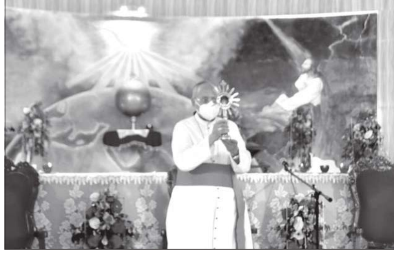
புனித அந்திரேயார் இயேசுவைப் போல உண்மையான ஆன்மீகத்தில் இறை நம்பிக்கையில் வாழ்ந்து புனிதர்களாக மாற நாம் அனைவரும் பாடுபட வேண்டும். புனித அந்திரேயார் நம்மைப் போலவே சதையும் இரத்தமும் கொண்ட ஒரு சாதாரண மனிதர்கள் விண்ணரசை அடைய விரும்பினார். எனவே இறைவன்

புனித அப்போஸ்தலரான அந்திரேயார் திருப்பண்டம் நினைவுச்சின்னம் அடங்கிய பேழை ஞாயிற்றுக்கிழமை கொடும்பு மோதரை உப்புளும் புனித அந்திரேயார் தேவாலயத்தில் உத்தியோகபூர்வமாக ஒப்படைக்கப்பட்டது.