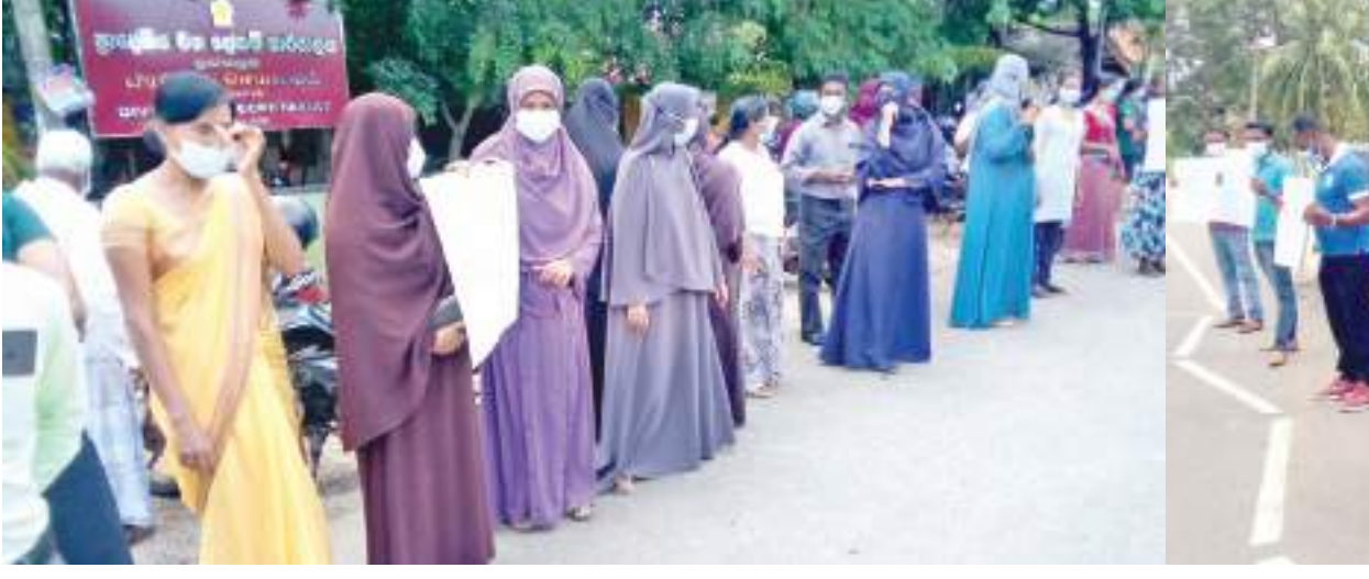
சம்பம் உயர்வு உட்பட பல்வேறு கோரிக்கைகளை முன்வைத்து புத்தளம் பிரதேச செயலகத்தில் கடமையாற்றும் ஊழியர்கள் நேற்று (29) பிரதேச செயலகத்துக்கு முன்பாக ஆர்ப்பாட்டத்தில் ஈடுபட்டதை படங்களில் காணலாம்.