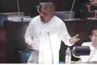
அரசாங்கத்தில் அமைச்சராக இருக்கும் டக்ளஸ் தேவானந்தா அவரை