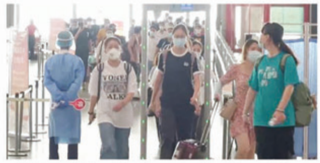
தென்னாப்பிரிக்கா, ஹொங்காங் மற்றும் போட்ஸ்வானா ஆகிய நாடுகளில் பரவும் புதிய வகை கொரோனா வைரஸ் குறித்து, மத்திய அரசு மாநில அரசுகளுக்கு எச்சரிக்கை விடுத்துள்ளது. இதனையடுத்து, வெளிநா

-நாட்டு மக்களிடம் மன்னிப்பு கோரிய பிரதமர் -