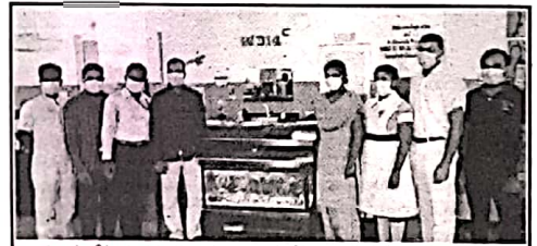
தலைவியுடைய ஆதார வைத்தியசாலையின் புற்றுநோய்ச்சிகிச்சைப் பிரிவுக்கு புலம்பெயர் வந்தகர் ஒருவரின் நிதிப்பங்களியில் அனாதர மீன்களுடன் கூடிய மீன்வாழ்வு நேற்று குடியிருக்கிறோம் அன்பளிப்பாக வழங்கிவைக்கப்பட்டது.

கப்பட்டுள்ள பொதுமலசலகூடத்தினை இதவரை பொது மக்கள் பாவனைக்கு உரிய முறையில் கையாளக்கூடவில்லை என வர்த்தகர்கள், பொதுமக்கள் குற்றம் சாட்டினர். மேற்படி பகுதியில் அமைக்கப்பட்டுள்ள மலசலகூடத்தின் கட்டுமானப்பணிகள் நிறைவு பெற்று 04 ஆண்டுகள் கடந்துள்ள நிலையிலும், அதற்கான தண்ணீர் வசதி இதுவரை ஏற்படுத்தப்படவில்லை எனப்பலவேறு தரப்பினரும் குற்றம் சாட்டியுள்ளனர். (4-5-315)