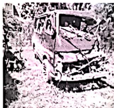
(திருமலை) ஹதரஸ்கொட்டுவ பொலிஸ் பிரிவுக்குட்பட்ட கண்டி திருகோ

ணமலை பிரதான வீதியில் நேற்றுக்காலை இடம் பெற்ற வாகன விபத்தில் ஒருவர் உயிரிழந்துள்ளதாக பொலிஸார் தெரிவித்தனர்.