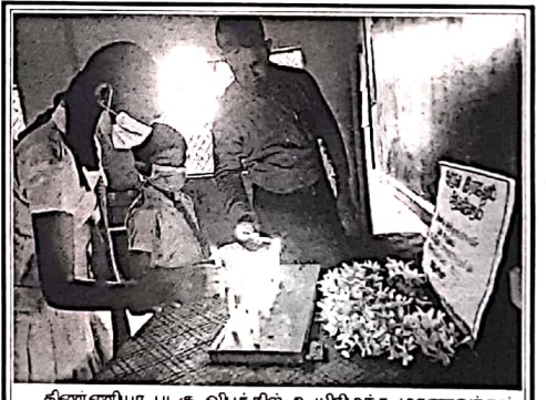
கிணையா படகு விபத்தில் உயிரிழந்த மாணவர்கள் உள்ளிட்டவர்களுக்கு முல்லைத்தீவு கூழாமுறிப்பு அ.த.க. பாடசாலை மாணவர்கள் நேற்று அஞ்சலி செலுத்தினர்.

தேக நபரை சேதித்த போது 161வோ 855கிராம் கேரளா கஞ்சாவுடன் கைது செய்யப்பட்டார். குறித்த நபர் புகைத்துடிப்புவல்லிபுர மருதங்கேணி சேரித்தவர். மேலதிக விசாரணைகளை மருதங்கேணி பொலிஸ் பிரிவினருக்கு கிடைக்கப் பெற்ற தகவலுக்கமைய குறித்த சந்தேக நபரை சேதித்த போது 161வோ 855கிராம் கேரளா கஞ்சாவுடன் கைது செய்யப்பட்டார். குறித்த நபர் புகைத்துடிப்புவல்லிபுர மருதங்கேணி சேரித்தவர். மேலதிக விசாரணைகளை மருதங்கேணி பொலிஸ் பிரிவினருக்கு கிடைக்கப் பெற்ற தகவலுக்கமைய குறித்த சந்தேக நபரை சேதித்த போது 161வோ 855கிராம் கேரளா கஞ்சாவுடன் கைது செய்யப்பட்டார். (4-5-316)