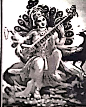
நலன்களை மாய்ந்தால் நலன்கள் தூக்கில் வீழ்ந்து மாய்விடும் விருச்சிக இராசி வாசகர்களே!

இம்மாதம் செவ்விரை உயரும். செயற்பாடுகளில் வெற்றி கிடைக்கும். கணவன்-மனைவிக்குள் ஒற்றுமை பண்பும். பிள்ளைகளின் எதிர்கால நலன் கருதி எடுத்த முயற்சிகளில்