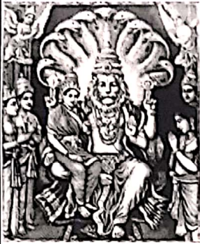
வழிபாடே வளர்ச்சிக்கு காரணம் என்று சொல்லும் துலாம் இராசி வாசகர்களே!

கார்த்திகை மாதக் கிரக நிலைகளை ஆராய்ந்து பார்க்கும் பொழுது... மாதத் தொடக்கத்தில் உங்கள் இராசியில் செவ்வாய்-சனி பார்வை உள்ளது. எனவே மிகமிக கவனத்துடன் செயற்பட வேண்டிய நேரமாகும். ஆரோக்கியத் தொல்லைகளும், அதிக விரயங்களும் ஏற்படும்.