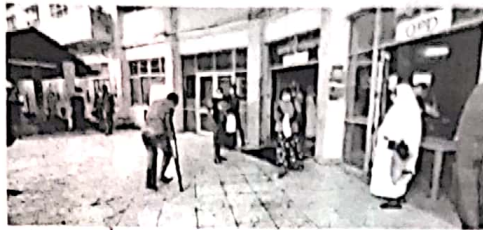
பல்வேறு மருத்துவ தேவைக்காக வந்த நோயாளிகள் மிகுந்த ஏமாற்றத்துடன் திரும்பிச் சென்றனர். (4-5-299)

குறிப்பாக சீர்தர காலநிலை காரணமாக நேற்று பெய்த மழையினாலும் பொருட்படுத்தி வைத்தியசாலைக்கு