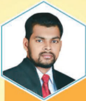
மி.டி.பி.டி.எல். கமலம் கம்பறா

மி.எஸ்.எம்.எல்.டி. தனதன் நிதான விளை கண்டி