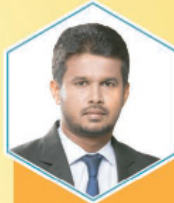
மி.ஆ.ஆ. குமார சத்தமங்க ஈர்வோட்டை