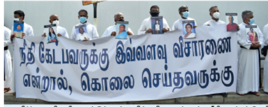
உயிர்த்த ஞாயிறு தின ஊர்ஊர் தாக்குதலில் பலியானவர்களுக்கு நீதி வழங்கக் கோரியும் அருட்தலைவர் சிறீஸ்ரீமணிவரக தொடர்ந்து விசாரணைக்கு அழைப்புகள் எதிர்ப்பு வெறித்தும் கொழும்பு மதுரை மாஸ்டர்தினர் ஹாக்கிள்கள்களை அருட தலைவர்கள் அமைதியான வழியில் போராட்டமென்று கொழும்பு கோட்டையில் அமைதியான குற்றவியல் விசாரணை நிலையங்களிலுக்கு முன்னால் நேற்று தினம் நடத்தியபோது... (படப்பிடிப்புத்தொகுதி சமீபம்)

(இராஜதுரை ஹஷான) உணவுப்பொதி ஒன்றின் விலை 20 ரூபாளினாலும் தேநீர் கேப்பை ஒன்றின் விலை 5 ரூபாளினாலும் அதிகரிக்கப்படுவதாக சிறுநடைச்சாலை உரிமையாளர்கள் சங்கத்தினர் அறிவித்துள்ளனர். மேலும் ஏனைய உணவுப்பொருட்களின் விலைகளும் ஒப்பீட்டளவில் அதிகரிக்கப்பட்டுள்ளன. சமையல் எளிதாக்கும் மற்றும் மரக்கறி உள்ளிட்ட அத்தியாவசிய பொருட்களின்