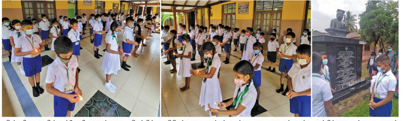
கிண்ணியா, குறிஞ்சாக்கோவில் பட்டப்பாதை கவிழ்த்த உயிரிழந்த மாணவர்கள் உட்பட அனைவரையும் ஆதரவு சாதிக்காக வந்தவை அருண் மாணிக்கவாசகம் இங்குக்கல்லூரி மாணவர்கள் நேற்றுமுன்தினம் பாடசாலை மண்டபத்தில் மெலுகுவந்தி வீதி பிரார்த்தனைவில் எடுக்கப்பட்டு...

(எம்.யனோசிதரா) வயதுக்கு மேற்பட்டோராவர். மேலும் நேற்று மரண வரை 529 கொவிட் தொற்றாளர்கள் இனங்காணப்பட்டனர். அதற்கு உறுதிப்படுத்தப்பட்ட 27 மரணங்களுடன் மொத்த கொவிட் மரணங்களின் எண்ணிக்கை 14,232 ஆக உயர்வடைந்துள்ளது. இவ்வாறு இனங்காணப்பட்ட தொற்றாளர்களுள் 528,400 பேர் குணமடைந்துள்ளனர். 17,502 பேர் தொடர்ந்து சிகிச்சை பெற்று வருகின்றனர்.