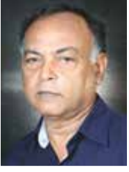
எஸ். அன்ரஸி நோர்பேட (முன்னாள் சிரேஷ்ட பேராசிரியர், கொழும்பு பல்கலைக்கழகம்)

தென்னாசியாவின் வானிலையில் மே - செப்ரெம்பர் வரை ஆதிக்கம் செலுத்திய கோடை 'மொன்சூன்' பின்வாங்கியதற்குப் பின்னர் ஒக்ரோபர் - நவம்பர் காலத்தைக் கொண்ட இடைமொன்சூன் பருவம் ஆரம்பிக்கும். இந்தப் பருவத்தின் பிரதான வானிலை அம்சங்களாகக் காற்றுக்கள் ஒன்று கலக்கும் ஒருங்கல் வலயம், மேற்காவுகை நிகழ்வுகள், புயல்கள் மற்றும் சூறாவளிகள் என்பன இடம்பெறும். தென்மேல் மொன்சூன் காற்று இம்முறை வழக்கத்துக்கு மாறாகத் தாமதத்தே பின்வாங்கியது. இந்நிலையில் தென் அந்தமான் தீவுக்கு அண்மையிலுள்ள கடற்பரப்புக்களிலும், வங்காள விரிகுடாக் கடலிலும் தாழ்முகங்கள் உருவாகி வலுப்பெறத் தொடங்கின. வானிலைச் செய்மதிகளின் துணையுடன் வானிலை எதிர்வுகூறலை மிகத் துல்லியமாக மேற்கொண்டு வரும் இந்திய வானிலை ஆய்வு மையம், வங்காள விரிகுடாக் கடலில் ஏற்படப்போகும் தாழ்முகங்கள் பற்றி மிகத் தெளிவாக மக்களுக்கு எடுத்துக் கூறியுள்ளது.