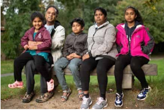
திகதி மின்னஞ்சலில் அவர்களின் புகலிடக்கோரிக்கை நிராகரிக்கப்பட்டு விட்டதாக உள்துறை அலுவலகம் தெரிவித்திருந்தது.

செப்டம்பர் 2021 இல் பிரிட்டலில் இருந்து லண்டன் ஹோட்டலுக்கு அழைத்து சென்ற அதிகாரிகள் அவர்களுடைய புகலிடக்கோரிக்கை பரிசீலனையின் கீழ் உள்ளது எனத் தெரிவித்திருந்தனர். எனினும் ஒக்டோபர் 11 ஆம்