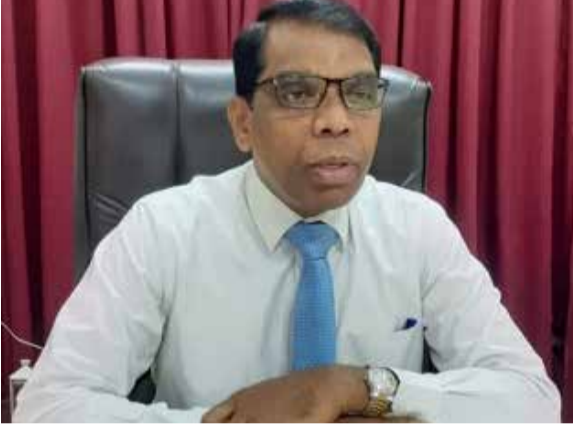
பாவனையாளர் அதிகார சபையினரால் யாழ்ப்பாண மாவட்டத்தில் எரிவாயு அடுப்பு வெடித்தல் இடம்பெற்ற பிரதேசங்களில் உள்ள பொலிஸ் நிலையங்கள் ஊடாக