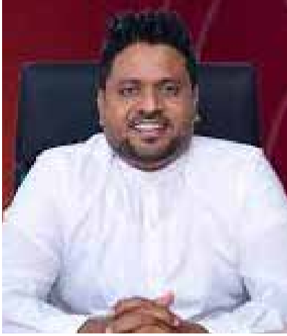
வின் தலைமையகத்தில் நடைபெற்ற உட்கூலியலாளர் சந்திப்பிலேயே அவர் மேற்கண்டவாறு தெரிவித்தார்.

அப்போது எதிர்க்கட்சியில் இருந்த ஒரு பெண் நாடாளுமன்ற உறுப்பினரும் இது தொடர்பாகக் குரல் எழுப்பவில்லை என்றும், தற்போது போலியாக பெண் விடுதலைக்காகப் பேசுகின்றனர் எனவும் அவர் குறிப்பிட்டுள்ளார். ஸ்ரீலங்கா பொதுஜன பெரமுன