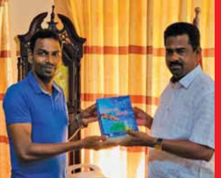
நேற்று (02) பெற்றுக் கொள்வதை படத்தில் படத்தில் காணலாம்.