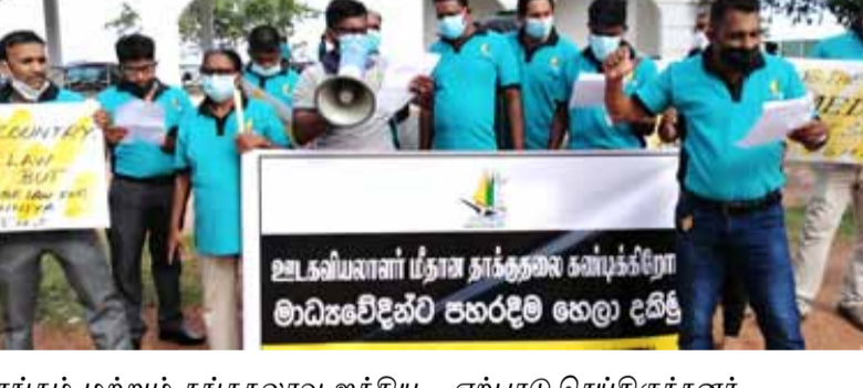
சங்கம் மற்றும் கங்கதலாவு ஐக்கிய ஊடக ஒன்றியம் இணைந்து இதனை ஏற்பாடு செய்திருந்தனர். கிண்ணியாவில் அண்மையில்

ஊடகவியலாளர்களின் தாக்குதலை கண்டித்து கிண்ணியாவில் கவனயீர்ப்பு போராட்டம் புத்தகிழமை இடம்பெற்றது. குறித்த கவனயீர்ப்பானது திருகோணமலை மட்டக்களப்பு பிரதான வீதியில் உள்ள பஸ்தரிப்பிட முன்றலில் இடம்பெற்றது. ஊடகத்தில் கைவைக்காதே ஊடகவியலாளர் மீதான தாக்குதலை கண்டிக்கிறோம் என்கிற தாக்குதலை கண்டிக்கிறோம் இக்கவனயீர்ப்பில் ஈடுபட்ட ஊடகவியலாளர்கள் தெரிவித்தனர். திருகோணமலை மாவட்ட ஊடகவியலாளர்