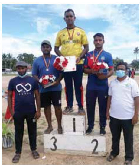
தேசிய மட்டப் போட்டிக்கு தேர்வு செய்யப்பட்டுள்ளார். இரண்டாம் இடத்தை அக்கரைப்பற்று பிரதேசத்தைச்

அம்பாரை மாவட்டத்தில் 20 வயதுக்கு மேற்பட்டவர்களுக்கான மெய்வல்லுனர் போட்டி நிகழ்ச்சியில், குண்டு போடுதல் போட்டி நிகழ்ச்சி அட்டாளசேன பொது விளையாட்டு மைதானத்தில் (30) நடைபெற்றது. இதில் கலந்துகொண்டு தனது திறமையை வெளிப்படுத்தி முதலாம் இடத்தினைப் பெற்று