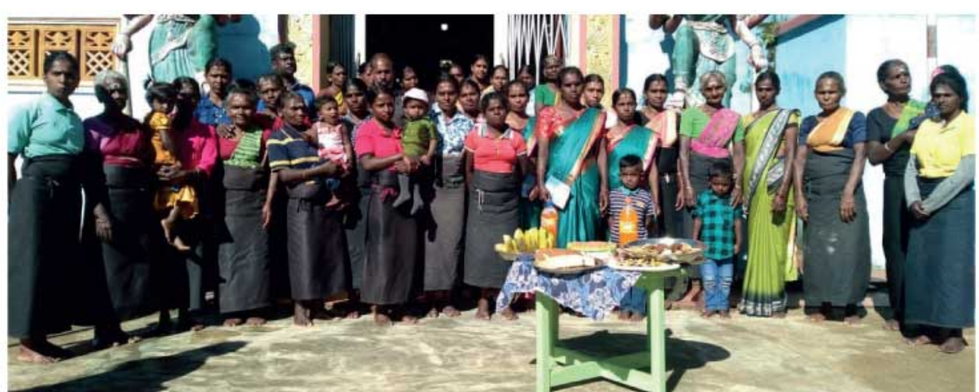
ஹெல்ஸ் கம்பினிள் கீழ் இயங்கும், தலவாக்கலை -கிரேட்லெண்ட் லூசா தோட்ட நிர்வாகத்தால் உத்தோட்ட தொழிலாளர்களின் பிறந்தநாள் கேக் வெட்டி கொண்டாடப்பட்டது. ஒவ்வொரு மாதமும் பிறந்தநாள் கொண்டாடும் சினைத்து தொழிலாளர்களையும் ஒர் இடத்திற்கு வரவழைத்து, தோட்ட நிர்வாகத்தால் கேக் வெட்டி பிறந்தநாள் கொண்டாடப்படுகின்றமை சிறப்பம்சமாகும். (பி. கேதீஸ்)