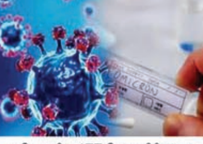
ஒரே நாளில் 477 பேர் உயிரிழந்துள்ளனர். இதன்மூலம் உயிரிழந்தோர் மொத்த எண்ணிக்கை 4,69,724 ஆக உயர்ந்துள்ளது என்று தெரிவிக்கப்பட்டுள்ளது.

இதுதொடர்பாக மத்திய சுகாதார அமைச்சகம் வெளியிட்டுள்ள தகவலின் அடிப்படையில், இந்தியாவில் நேற்று காலையுடன் முடிந்த 24 மணி நேரத்தில் புதிதாக 9 ஆயிரத்து 765 பேருக்கு தொற்று பாதிப்பு உறுதியாகி உள்ளது. இதன்மூலம் மொத்த கொரோனா பாதிப்பு எண்ணிக்கை 3,46,06,541 ஆக அதிகரித்துள்ளது. அதேபோல், தொற்று பாதிப்புகளுக்கு