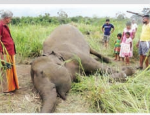
மாநிலத்தில் 32 யானைகள் கொல்லப்பட்டுள்ளன. தமிழகத்தில் ஒரு யானை கொல்லப்பட்டுள்ளது.

இந்தியாவில் பல்வேறு காரணங்களால், கடந்த 10 ஆண்டுகளில் 1,160 யானைகள் கொல்லப்பட்டுள்ளதாக தெரிவிக்கப்பட்டுள்ளது.