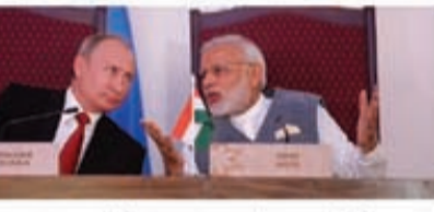
துப்பாக்கிகள் ரஷ்யாவின் உதிரி பாகங்களுடன் தயாரிக்கப்படும் என்று தகவல் வெளியாகியுள்ளது.

யின் போது கையெழுத்திட உள்ளது. ஏற்கனவே எஸ்.600 ரக ஏவுகணைத் தடுப்பு சாதனங்களையும் இந்தியா வாங்கியுள்ளது. ரஷ்யாவின் தொழில்நுட்ப உதவியுடன் இந்த துப்பாக்கிகள் உத்தரப்பிரதேச மாநிலம் அமேதியில் தயாரிக்கப்பட உள்ளன. புதன் கையெழுத்திட்டதும் முதலில் 70 ஆயிரம்