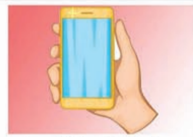
கிறது. இந்திலையில், இரண்டாவது டோஸ் செலுத்திக் கொள்ள, மக்களை ஊக்குவிக்கும் விதமாக, ஒரு பரிசு திட்டத்தை மாநில அரசு அறிமுகம் செய்துள்ளது.

அரசு உறுதியாக உள்ளது. இங்குள்ள ஆமதாபாதி, இதுவரை 78.7 இலட்சம் பேர் தடுப்பூசிகளை செலுத்தி உள்ளனர். இதில், 31 இலட்சம் பேர், இரண்டு டோஸ்களையும் செலுத்தி உள்ளனர்; 47.7 இலட்சம் பேர், முதல் டோஸை மட்டும் பெற்றுள்ளனர். இவர்களுக்கு இரண்டாவது டோஸை செலுத்தி முடிக்க, மாநகராட்சி நிர்வாகம் பல வழிகளில் முயற்சித்து வருகிறது.