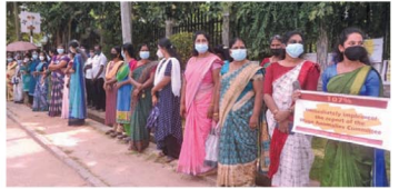
கோரி கீழ்க்குப் பல்கலைக்கழக கல்விசாரா ஊழியர்கள் நேற்று கவனிப்புப் போராட்டத்தில் ஈடுபட்டனர். கீழ்க்குப் பல்கலைக்கழக வந்தாயமுலை வளாக முன்