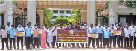
(செங்கலடி திருபுர) பல்கலைக்கழக கல்விசாரா ஊழியர்களுக்கு முதுகூட்டப்பட்ட 107 சதவீத சம்பள உயர்வை உடனடியாக வழங்குமாறு