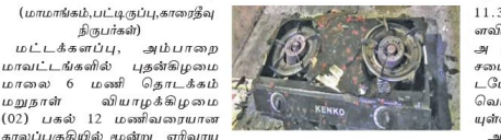
(மாணாங்கம், பட்டிபட்டி, காணாலை திருபுர) மட்டக்களப்பு, அம்பாறை மாவட்டங்களில் புதன் கிழமை மாலை 6 மணி தொடக்கம் மறுதான் விவசாயக்கிழமை (02) பகல் 12 மணிவரையான காலப்பகுதியில் மூன்று எரிவாயு அடுப்புகள் வெடித்துச் சிதறியுள்ளதாக அந்த தந்த பிரிவு பொலிஸார் தெரிவித்தனர். காதலாண்டி, பொலிஸார் பிரிவினரின் கல்வடி பாலத்திற்கு அருகாமையிலுள்ள வீடு ஒன்றில் நேற்று விவசாயக்கிழமை (02) பகல்

11.30 மணி வரையில் எரிவாயு அடுப்பில் சைக்கிள் முறிப்பு அடுப்பு வெடித்துச் சிதறியுள்ளது. அதேவேளை காந்தளம், மொடோன் பாம்பு பகுதியிலுள்ள வீடு ஒன்றில் நேற்றுமுன்தினம் புதன் கிழமை இரவு எரிவாயு அடுப்பு வெடித்துச் சிதறியுள்ளது. இது இரு வெடிப்புச் சம்பவங்களினால் எவருக்கும் பாதிப்பு ஏற்படவில்லை என காதலாண்டி, பொலிஸார் தெரிவித்தனர். இதுவேளை அம்பாறை, சம்பாந்துறை பொலிஸார் பிரிவினரின் வளத்தூர் அடுப்பு நேற்று முற்பகல் 11 மணிவரையில் வெடித்துச் சிதறியுள்ளதாகவும் இச்சம்பத்தில் எவருக்கும் பாதிப்பு ஏற்படவில்லை எனவும் சம்பாந்துறை பொலிஸார் தெரிவித்தனர். இந்த வெடிப்புச் சம்பவங்கள் தொடர்பாக அந்தந்த பிரதேச பொலிஸார் விசாரணைகளை மேற்கொண்டுள்ளனர்.