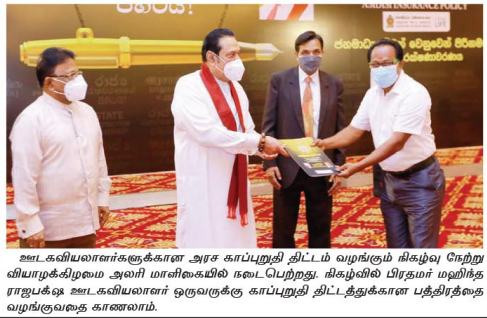
ஊடகவியலாளர்களுக்கான அரசு காப்புறுதி திட்டம் வழங்கும் நிகழ்வு நேற்று விழாவுக்கிழமை அலரி மாளிகையில் நடைபெற்றது. நிகழ்வில் பிரதமர் மஹிந்த ராஜபக்ஷ ஊடகவியலாளர் ஒருவருக்கு காப்புறுதி திட்டத்துக்கான பத்திரத்தை வழங்குவதை காணலாம்.

கடுமையான தீர்மானங்களை எடுக்க வேண்டிய கட்டாயத்தில் அரசு; பிரதமர் மஹிந்த இறுதிக்கட்ட போரில் முன்னெடுக்கப்பட்ட சதி முயற்சிகளை போன்று தற்போதும் மக்களின் சுதந்திரத்தையும் நாட்டின் உரிமத்தையும் கைப்பற்றும் 10