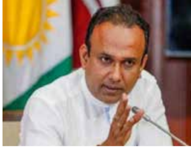
அமைச்சரவை முடிவுகளை அறிவிக்கும் ஊடகவியலாளர் சந்திப்பு நேற்று நடைபெற்றது. இதில் கருத்து வெளியிடும்போதே

“நத்தார் பண்டிகை காலத்தில் நாட்டை முடக்குவது தொடர்பில் எந்தவொரு தீர்மானமும் எடுக்கப்படவில்லை. எனினும், அபாயத்திலிருந்து நாம் இன்னும் முழுமையாக மீளவும் இல்லை. எனவே, அனைவரும் பொறுப்புடன் செயல்படவேண்டும்.” _ என்று அமைச்சரவை இணைப்பேச்சாளரும், அமைச்சருமான ரமேஷ் பத்திரண தெரிவித்தார்.