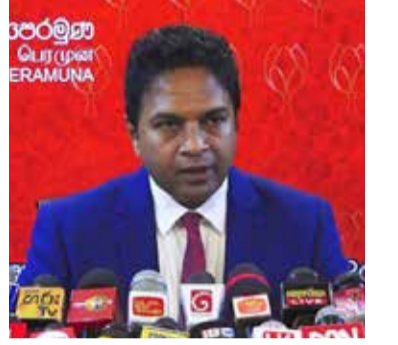
அரசுக்குள் இருந்து கொண்டு, சிறப்புரிமைகளை அனுபவித்தபடியே அவர்கள் விமர்சிக்கின்றனர். அவர்களின் கொள்கை என்னவென்பது புரியவில்லை” - என்றார். (இ)

கட்சியினர் முயற்சிக்கின்றனர். உரப்பிரச்சினையின்போது அரசுக்கு எதிர்ப்பு ஏற்பட்டது. இந்நிலையில், இந்தத் திட்டத்துக்கு தாமதம் எதிர்ப்பு என சுதந்திரக் கட்சி 'பல்டி' அடித்தது. சிலவேளை இந்தத் திட்டம் வெற்றியளித்திருந்தால் அதற்கும் தான்தான் காரணம் என மைத்திரிபால சிறிசேன உரிமை கோரி இருப்பார்.