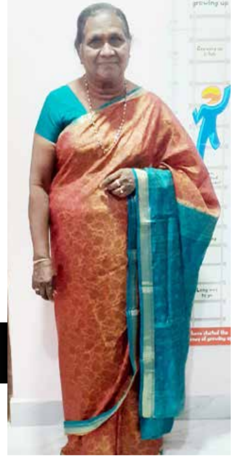
மல் ஒட்டுமொத்த சமூகத்திலும் மாற்றங்கள் உருவாகிறது.

கூட்டுறவின் ஏனைய பிரிவுகளில் இளம் தலைமுறையினரின் பங்குபற்றல் குறைவானதாக இருக்கின்றபோதிலும் சி.க.குகளில் இளம் பெண்கள் நிர்வாக செயற்பாடுகளை செய்யக்கூடியதாக உள்ளது. இது கூட்டுறவுத்துறையை பலப்படுத்துவதோடு விளிம்புநிலை சமூகங்களில் உள்ள பெண்கள்கூட தமது ஆழுமைகளையும் வளர்த்துக் கொண்டு தான் சார்ந்த சமூகத்திலும் மாற்றங்களை கொண்டுவர உதவுகிறது. அதாவது பெண்களால் இனங்காணப்படும் பிரச்சினைகள் குடும்பம் மற்றும் சமூகம் ஆகிய இரண்டையும் பிரதிபலிப்பதாக உள்ளது. அதற்கான தீர்வுகளை அவர்கள் நாடும்போது குடும்பத்தில் மட்டுமல்லா