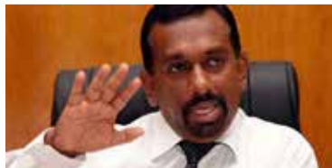
செலவாகின்றது. அதேபோல், எல்.என்.ஜியில் உற்பத்தி செய்யப்படும் மின்சார அலகு ஒன்றுக்கு 18 ரூபாய்க்கு

பாராளுமன்றில் மஹிந்தானந்த உறுதி கொழும்பு, டி.செ. 01 “யுகதனவி ஒப்பந்தம் நாட்டுக்கு நன்மை பயக்கா விடின் அரசில் அங்கம் வகித்தாலும் அதற்கு ஆதரவு வழங்க முடியாது என அமைச்சர் மஹிந்தானந்த அளுக்கமகே பாராளுமன்றத்தில் தெரிவித்தார். டீசல் நிலையங்களிலிருந்து உற்பத்தி செய்யப்படும் மின்சார அலகொன்றுக்கு 25 ரூபாய்