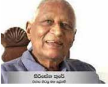
ஐ.தே.கவின் முன்னாள் செயலாளர் காலமானார்

கொழும்பு, டி.செ. 01 ஐக்கிய தேசியக் கட்சியின் முன்னாள் பொதுச்செயலாளரும் முன்னாள் அமைச்சருமான பி. சிறிசேன குரே காலமானார்.