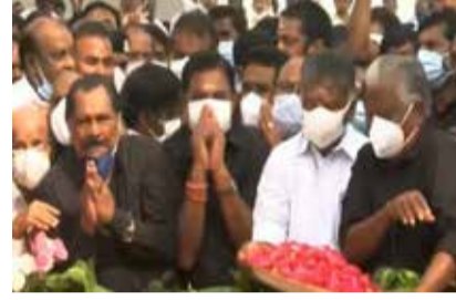
ஜெயலலிதா உடல்நலக்குறைவால் பாதிக்கப்பட்டு கடந்த 2016 ஆம் ஆண்டு செப்டெம்பர் 23 ஆம் திகதி சென்னையில் உள்ள அப்போலோ மருத்துவமனையில் சேர்க்கப்பட்டார்.

சென்னை, டி.செ 06 தமிழக முன்னாள் முதலமைச்சர் ஜெயலலிதாவின் ஐந்தாவது நினைவிடத்தை முன்னிட்டு அவரது நினைவிடத்தில் நேற்று ஓ.பி.எஸ்., ஈ.பி.எஸ். மலர்தூவி மரியாதை செலுத்தினர். அங்கு அவர்கள், “அம்மா உணவகம், அம்மா மருந்தகம் திட்டங்களை நிறுத்துவோரின் கொட்டங்கள் அடக்கப்படும், நீட் தேர்வு இரத்து, கல்விக்கடன் ரத்து என்று பொய் வாக்குறுதியளித்த முதலமைச்சர், இனியும் தமிழர்களை ஏமாற்ற விடமாட்டோம்” என்று உறுதிமொழி எடுத்தனர். தமிழக அரசியலில் இரும்பு பெண்மணியாக உலா வந்த மறைந்த முதலமைச்சர்