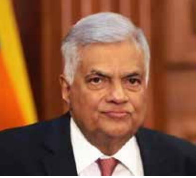
அடுத்த வருடத்திற்கான வரவு - செலவுத் திட்டம் தொடர்பாக பாராளுமன்

கொழும்பு, டிசெ. 08 நிதியமைச்சர் பஸில் ராஜபக்ஷவின் திடீர் இந்திய விஜயம் தொடர்பான அனைத்து விவரங்களையும் வெளியிடுமாறு ஐக்கிய தேசியக் கட்சியின் தலைவரும் பாராளுமன்ற உறுப்பினருமான ரணில் விக்ரமசிங்க அரசாங்கத்திடம் கோரிக்கை விடுத்துள்ளார்.