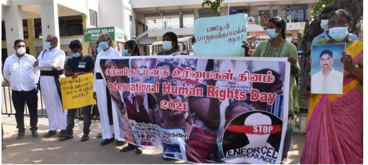
காணாமல் ஆக்கப்பட்ட உறவுகளுக்கு நிரந்தரத் தீர்வைப் பெற்றுத் தருவீர்களா?' ஆகிய பல்வேறு

இதன்போது கவனவீர்ப்பு போராட்டத்தில் ஈடுபட்டவர்கள், 'இரானுவத்திடம் ஒப்படைக்கப்பட்ட எம் உறவுகள் எங்கே?, மனிதம் பாதுகாக்கப்படுகிறதா?, அரசே காணாமல் ஆக்கப்பட்ட எம் உறவுகள் எங்கே?,