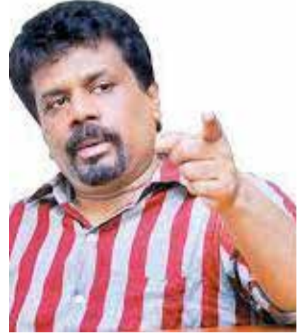
பெற்றுள்ளது. எனவே, பொறுப்பான முறையில் பொருளாதாரத்தை முகாமை செய்ய வேண்டும் - என்றார்.