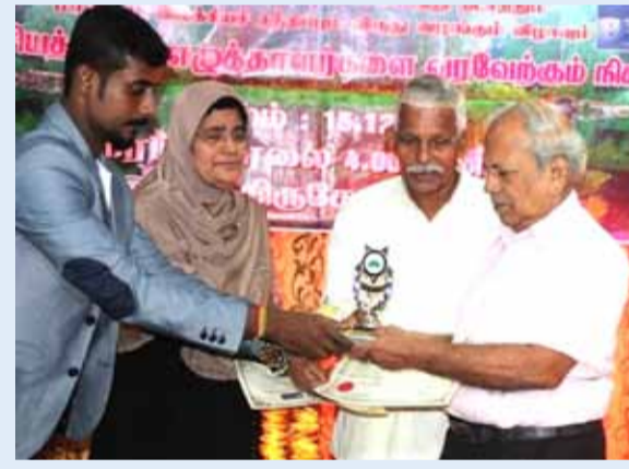
பிரிந்தபின் 08 நூல்களுக்கு மேல் விருதுகள் கிடைத்தன. மற்றும் யாழ் இலக்கிய வட்டம் இலக்கிய விருதுகள் 02 கிடைத்துள்ளன. கல்வி அமைச்சு கொழும்பு - தேசிய

இளம் எழுத்தாளர்கள் நிறையவே எழுதுகிறார்கள். அவர்களும் எழுதுவதை நூலாக்கி சந்தைப்படுத்தவில்லை சிக்கலில் தவிர்கிறார்கள். எழுதுவதைப் பலமுறை எழுதி படித்துத் திருத்தி எழுதிய பின்னர் சஞ்சிகைகளுக்கோ அல்லது தேசிய பத்திரிகைகளுக்கோ அனுப்பி அங்கீகாரத்தைப் பெறலாம். இன்று பல நிறுவனங்கள் அவர்களது நூல்களை வெளியிட தயாராகவே உள்ளனர். இளங்கலைஞர்கள் நன்கு வாசிக்க வேண்டும். வாசித்தவற்றையிட்டு யோசிக்க வேண்டும். அந்த நூல்களைப் பற்றி உங்கள் அபிப்பிராயங்களை எழுதி விமர்சிக்க வேண்டும். அந்த விமர்சனங்கள் ஆக்கபூர்வமானதாக அமைய