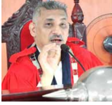
தேச சபை உருவாக்கப்பட்டது. பின்னர் கல்முனை பிரதேச சபையானது நகர சபையாகவும் மாநகர சபையாகவும் தரமுயர்த்தப்பட்டு இன்றளவில் இயங்கி வருகிறது.

கல்முனை மட்டக்களப்பு பிரதான வீதியில் துறைநீலாவணைக்கு செல்கின்ற பெரிய நீலாவணை சந்தியின் கிழக்கு புறமாக விசேட அதிரடிப்படைமுகாம் இயங்கி வருகின்ற இடமானது மருதமுனை, பாண்டிருப்பு மற்றும் பெரிய நீலாவணை பிரதேசங்களை உள்ளடக்கிய முன்னைய கரைவாகு (கல்முனை) வடக்கு கிராம சபைக் காரியாலயம் இயங்கி வந்த இடமாகும். 198ஆம் ஆண்டளவில் கல்முனை பட்டின சபையுடன் கரைவாகு வடக்கு கிராம சபையும் இணைக்கப்பட்டே கல்முனை பிரதேச செயலாளர் பிரிவில் 4 ஆயிரத்து 345 ஏக்கர், மடு பிரதேச செயலாளர் பிரிவில் 825 ஏக்கர், மன்னார் நகரம் பிரதேச செயலாளர் பிரிவில் 4 ஆயிரத்து 42 ஏக்கர் நெற்செய்கை மேற்கொள்ளப்பட்டுள்ள வயல் நிலங்கள் நீரில் மூழ்கியுள்ளன.