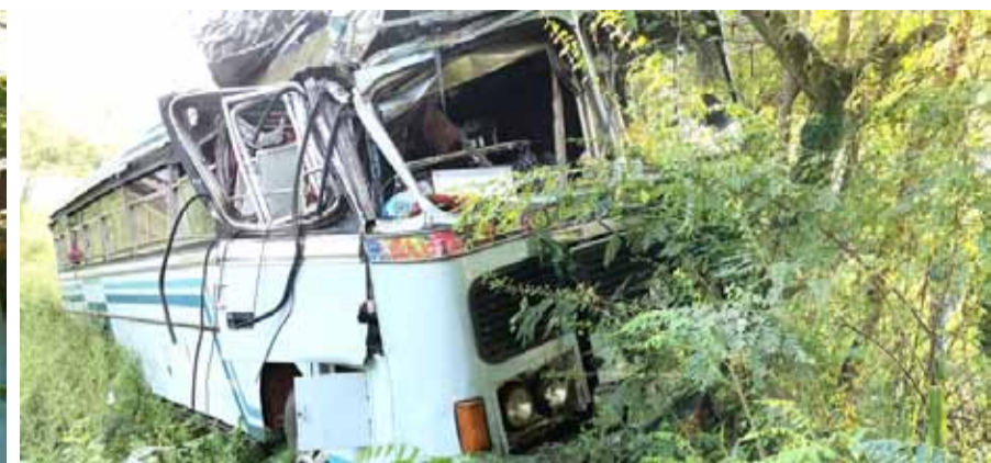
(திருமலை ரம்பீக் பாயிஸ்)

திருகோணமலை கண்டி பிரதான வீதி கப்பல்துறை மங்குபிரிஞ் பகுதியில் ஆடை தொழிற்சாலைக்கு சொந்தமான தனியார் பஸ்வெளி விபத்துக்குள்ளானதில் இதுவரை 26 பேர் காயங்களுடன் திருகோண