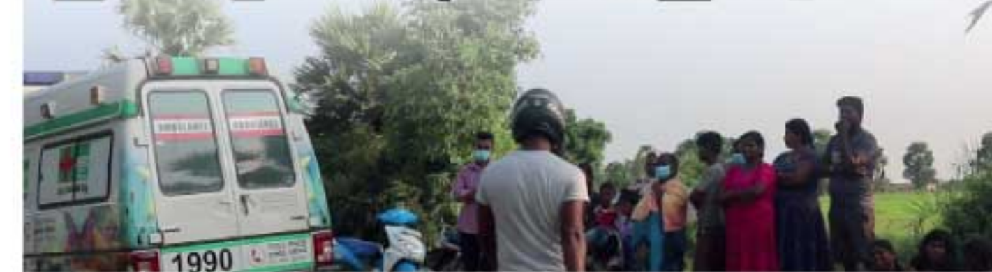
கிளிநொச்சி, உமையான்புரம், சோலை நகர் பகுதியில் குண்டொன்று வெடித்ததில் ஓருவர் மரணமடைந்தார். சம்பவத்தில் காயமடைந்த 13 வயதான சிறுவன், கிளிநொச்சி வைத்தியசாலையில் அனுமதிக்கப்பட்டுள்ளார்.