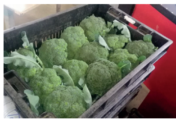
வரையும் பிரக்கோழி 2,500-3,000 ரூபாய் வரையும் சலாது 800 ரூபாய்க்கும் விற்கப்படுவதாக சுற்றுலா ஹோட்டல் உரிமையாளர்கள் தெரிவிக்கின்றனர்.

சுற்றுலா ஹோட்டல்களுக்கு வருசைத் தரும் வெளிநாட்டு சுற்றுலாப் பயணிகளுக்காகப் பெற்றுக்கொள்ளப்படும் காலிபிளவர், பிரக்கோழி, சலாது போன்றவற்றின் விலைகள், பாரியளவில் அதிகரித்துள்ளதாக சுற்றுலா ஹோட்டல் உரிமையாளர்கள் தெரிவித்துள்ளனர். காலிபிளவர் ஒரு கிலோ கிராம் 1500 - 2,000 ரூபாய்