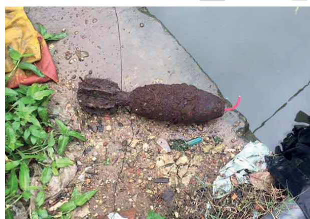
சிக்கியுள்ளது. இது தொடர்பில் யாழ்ப்பாணம் பொலிஸ் நிலையத்திற்கு தகவல் வழங்கப்பட்டது. அதனையடுத்து, நீதிமன்றத்தின் அனுமதியின் ஊடாக, விசேட அதிரடிப்படையினர் அக்குண்டை மீட்டெடுத்தனர்.

யாழ்ப்பாணம் மடம் வீதியில் உள்ளகால்வாய் ஒன்றில் சிறுவர்கள் மீள்பிடித்து விளையாடிக் கொண்டிருந்த போது அவர்களது தூண்டில் திடீரென ஒரு பாரமான பை அகப்பட்டுள்ளது. அதனைப் பிரித்துப் பார்த்த போது, அதில் வெடிகுண்டொன்று இருந்தமை கண்டறியப்பட்ட சம்பவம் யாழ்ப்பாணத்தில் இடம்பெற்றுள்ளது.