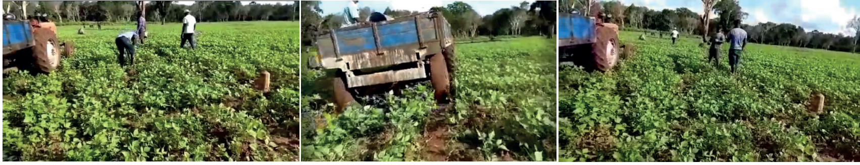
வவுனியாவில் வனவளத் திணைக்களத்தினர்