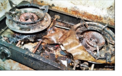
அடுப்பிலிருந்து ரெகுலேட்டரை கழற்றிய போது சமையல் எரிவாயு சிலிண்டரில் தீப்பிடித்ததுடன், மெலத்தை உட்பட பல பகுதிகளில் வெளியே வந்ததாகவும் அவர் கூறினார். கடந்த இரண்டு நாட்களுக்கு முன்னரும், சிறிய அளவில் இவ்வாறு வெடிப்புச் சம்பவம் இடம்பெற்றதாகவும் அவர் குறிப்பிட்டார்.

பாலாவி கரம்பை ஹூதா பள்ளி வீதியில் அல்ஹூதா பாலர் பாடசாலைக்கு முன்பாக உள்ள உணவகத்தில், பயன்படுத்தப்படாதிருந்த கேஸ் சிலிண்டரில் கசிவு ஏற்பட்டு முழுமையாக வெடித்துச் சிதறியது. இச்சம்பவம் நேற்று நிகழ்ந்தது. இதில், எவ்வித சேதங்களும் இடம்பெறவில்லை. சம்பவம் இடம்பெற்ற போது குறித்த உணவகத்தின் உரிமையாளர் மாத்திரமே இருந்துள்ளார். உணவுப் பண்டங்களை தயாரித்துக் கொண்டிருந்த போது, சமையலறையில் திடீரென வெடிப்புச் சம்பவம் இடம்பெற்றதாக ஹோட்டல் உரிமையாளர் கூறினார். மேலும்,