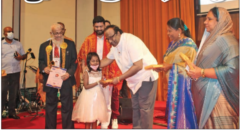
(தெலிவனை கல்லை விஷேட நிருபர்)

இலங்கை ஒலிபரப்புக் கூட்டுத்தாபன ஆனந்தசமரகோன் மண்டபத்தில், கடந்த ஞாயிறுக்கிழமை (28) நடைபெற்ற இசை நிகழ்ச்சியில், மக்கள் பாதுகாப்பு அமைச்சர் ரியர் அட்மிரல் சரத் வீரசேகர பிரதமர் அத்தியாகக்