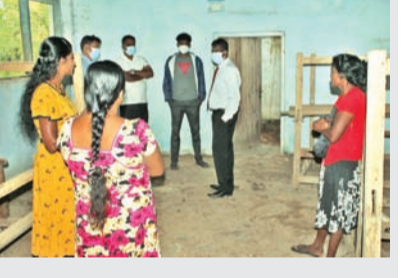
களின் வாழ்க்கைக்கான வாழ்வாதார உதவி இல்லாமல் இருப்பது கவலையளிக்கின்றது. அத்தோடு எமது சூழலில் கிடைக்கும் பன்னை மூலப்பொருளாக பயன்படுத்தி பின்னும் பாய்கள் செயற்கையான பாய்களைப் பார்க்கிலும் சுகாதார மேம்பாடு கூடியது மட்டுமல்லாமல், வேலையற்ற இளம் யுவதிகளுக்கு வேலைவாய்ப்பும் கிடைக்கும் எனத் தெரிவித்தார்.