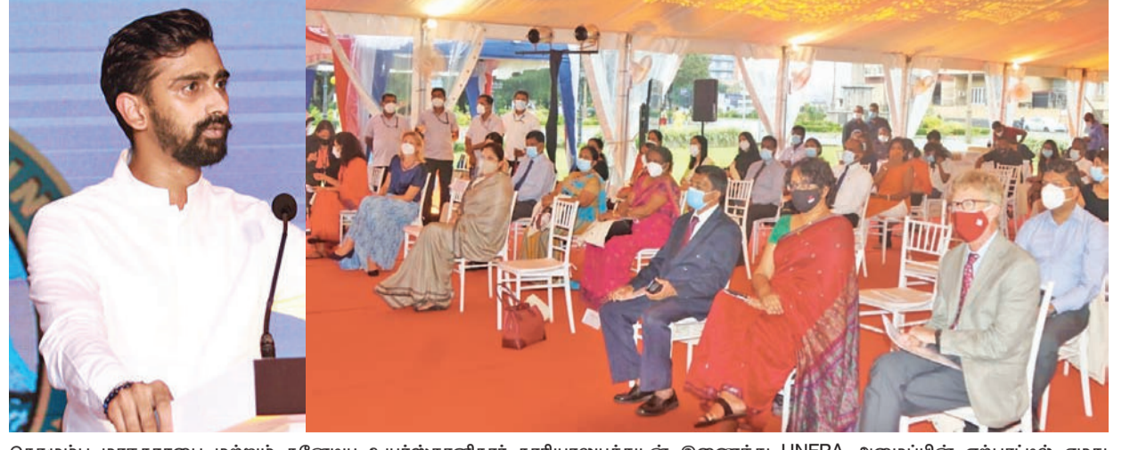
கொழும்பு மாநகரசபை மற்றும் கனேடிய உயர்நீதிமன்ற காரியாலயத்துடன் இணைந்து UNFPA அமைப்பின் ஏற்பாட்டில் எழுது நாட்டில் பாலின அடிப்படையிலான வன்முறைக்கு எதிரான உலகளாவிய செயற்பாட்டின் ஓர் அங்கமாக நிகழ்வொன்று இடம்பெற்றது. இந்நிகழ்வில் இராஜாங்க அமைச்சர் ஜீவன் தொண்டமான் சிறப்பு அதிபாக கலந்து கொண்ட உரையாற்றும் போது...

தொடர்ந்து பேசிய அவர்... மலையகத்தை பொறுத்தவரில் பெரும்பாலான மக்கள் தொடர் குடியிருப்புக்களிலேயே வாழ்ந்து வருகின்றனர். இவ்வாறான ஒரு குழந்தை நிலையில் வெடிப்பு சம்பவம் ஒன்று ஏற்பட்டால் முழு தொடர் குடியிருப்பினையே அது அழித்து விடும். ஆகவே இவ்வாறான சம்பவங்கள் மக்களை அச்சுறுத்துவதாகவே அமைந்துள்ளன. பொருளாதார நெருக்கடிக்கு மத்தியில் வாழும் இம்மக்களின் பாதுகாப்பை அரசு உறுதி செய்ய வேண்டும்.