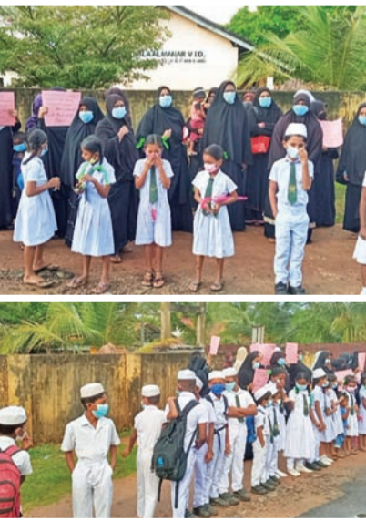
அவமானப்படுத்தியதாகவும், வெள்ளம் காரணமாக பாடசாலை மாணவர்கள் வழமையாக செல்லும் வழி சேரும் சக்தியுடைய காணப்படுவதால் பாடசாலைக்கான மற்ற நுழைவாயிலை திறக்க

பட்டோர் கோங்களை எழுப்பினர். பாடசாலையில் கற்பிக்கும் ஆசிரியை யொருவருக்கு குறித்த அதிபர் காவலக் கூட்டத்தில் மாணவர்கள் மத்தியில் ஏசி