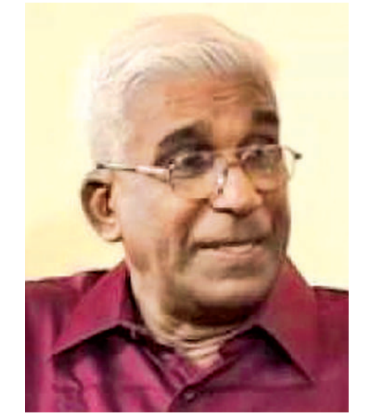
டச்சுக் காலத்தில் கேரளாவுக்கும், யாழ்ப்பாணத்திற்குமிடையே புகையிலை வியாபாரம் நடந்தது. எனது அம்மம்மா கேரளத்தைச் சேர்ந்தவர். ஆகையால், நான் ஒரு Hybrid.

எனது தாய்வழி உறவினர்கள் யாழ்ப்பாணம் நல்லூர் அத்தியடியைச் சேர்ந்தவர்கள். எனது பாட்டனார் ஒரு புகையிலைத் தரகர்.