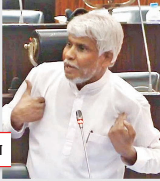
எப்படி மாவட்டத்திலே பறிந்துரைக்கப்பட்ட கோறளைப்பற்றி மத்தி பிரதேச செயலகம், கோறளைப்பற்றி தெற்கு பிரதேச செயலகம்

மத்தியில் அவர்கள் நிர்வாக ரீதியில் பல இன்னல்களையும் தடைகளையும் அனுபவித்து வந்தனர். அதன் பின்பு ஜூன் மாதம் 03ஆம் திகதி 1999 ஆம் ஆண்டு மறைந்த ரட்ணசித்ர விக்ரமநாயக்க உள்ளூராட்சி அமைச்சராக இருந்த போது பண்பாலான ஆணைக்குழு ஜனாதிபதியாகவிருந்த சந்திரகாவினால் அமைக்கப்பட்டது. அந்த எல்லை நிர்ணயக்குழுவின் அறிக்கை 2000ம் ஆண்டு 13ம் திகதி அஷ்ரப் மரணிப்பதற்கு 02 மாதத்திற்கு முன்பு அமைச்சரவரின் சமர்ப்பிக்கப்பட்டது. இதன்படி மட்டக்களப்பு மாவட்டத்தில் புதிதாக உருவாக்கப்பட்ட இரண்டு பிரதேச