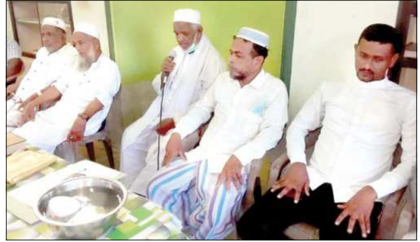
(புதிய காத்தான்குடி விசேட நிருபர்)