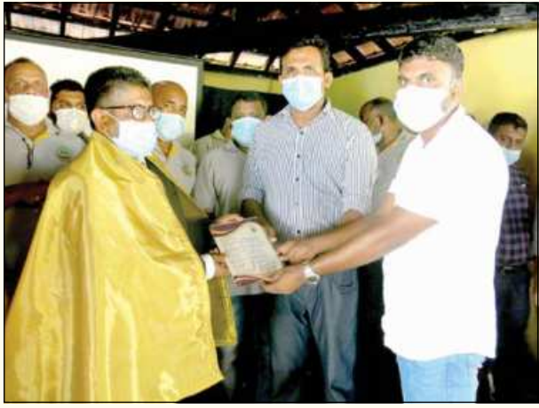
(மாவத்தகம் தினகரன் நிருபர்)

பாடசாலையின் தரத்தை உயர்த்த வேண்டுமாயின் ஆளுமையுள்ள தலைமைத்துவம் அவசியமென, இப்பாகமுவ கல்வி வலயப் பணிப்பாளர் ஸ்ரீமவன் பொடி நிலமே தெரிவித்தார்.