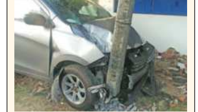
(வெல்லாவெளி தினகரன் நிருபர்)

பெரியகல்லாற்றில் ஸ்ரீலங்கா ரெலிகொம் கம்பத்தில் மோதிகார் ஒன்று விபத்துக்குள்ளாகியதில் வைத்தியர் இருவர் சிறு காயங்களுடன் கனவாஞ்சிகுடி ஆதார வைத்தியசாலையில் அனுமதிக்கப்பட்டுள்ளனர்.