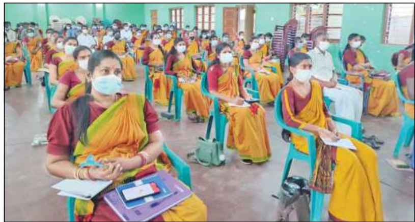
(பாண்டிருப்பு தினகரன் நிருபர்)

இந்து சமய கலாசார அலுவல்கள் திணைக்களத்தின் அனுசரணையில், மண்முனை தென் எருவில் பற்று பிரதேச செயலகத்தின் ஏற்பாட்டில் இந்து அறநெறி பாடசாலை ஆசிரியர்களுக்கான விழிப்புணர்வு கருத்தரங்கு ஞாயிற்றுக்கிழமை (05)