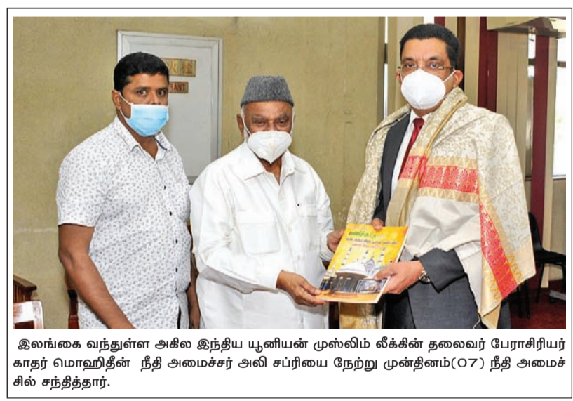
இலங்கை வந்துள்ள அகில இந்திய யூனியன் முஸ்லிம் லீக்கின் தலைவர் பேராசிரியர் காதர் மொஹம்தின் நீதி அமைச்சர் அலி சபீரியை நேற்று முன்தினம் (07) நீதி அமைச்சர் சந்தித்தார்.