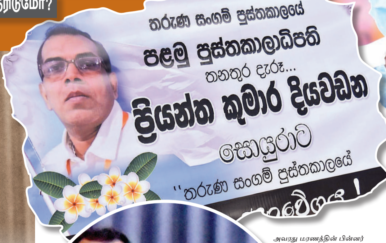
வரலாறு காலத்தின் சூட்சுமத்தின் சூட்சும சூட்சுமத்தின் வரலாறு காலத்தின் சூட்சுமத்தின் சூட்சும சூட்சுமத்தின்