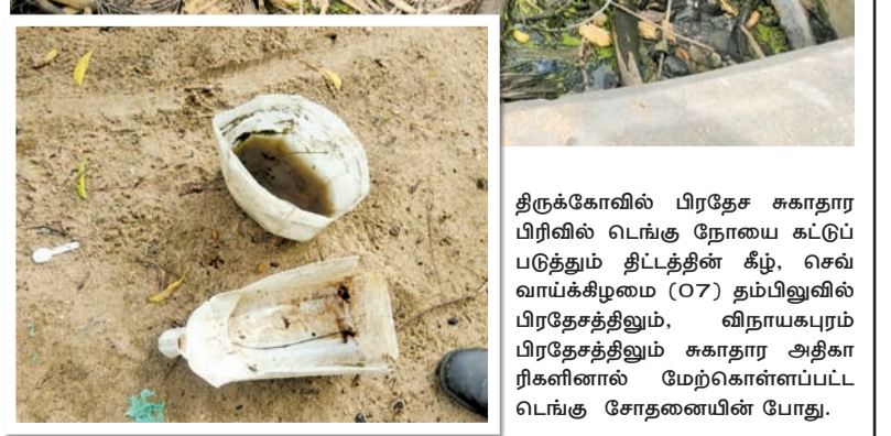
திருக்கோவில் பிரதேச சுகாதார பிரிவில் டெங்கு நோயை கட்டுப்படுத்தும் திட்டத்தின் கீழ், செவ்வாய்க்கிழமை (07) தம்பிபுளவில் பிரதேசத்திலும், விநாயகபுரம் பிரதேசத்திலும் சுகாதார அதிகாரிகளினால் மேற்கொள்ளப்பட்ட டெங்கு சோதனையின் போது.