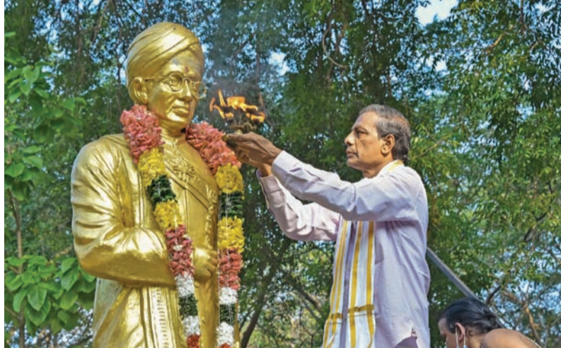
புகுத்திதுறை விசேட நிருபர்

யாழ்ப்பாணப் பல்கலைக்கழகம் உருவாங்கும் அடித்தளமான பரமேஸ்வராக் கல்லூரியின் நிறுவனரும், சைவப் பெரு வள்ளலானுமான சேர். பொன். இராமநாதனின் 91