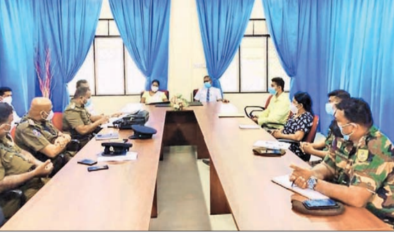
கந்தளாய் பிரதேச செயலாளர் பிரிவில் கோவிட் 19 நோய் பரவலதைத் தடுப்பதற்கான நடவடிக்கைகள் குறித்து பிரதேச கொரோனா குழு திங்கட்கிழமை (8) கூடியது. இந்நிகழ்வில் மாவட்ட சுகாதார வைத்திய பணிப்பாளர், சுகாதார வைத்திய அதிகாரி, வாலில் அதிகாரி, உதவி திட்டமிடல் பணிப்பாளர் உள்ளிட்டோர் கலந்துகொண்டபோது,

மூதூர் பிரதேச சபையின் 2022ஆம் ஆண்டிற்கான வரவு, செலவுத் திட்டம் 20 வாக்குகள் ஆதரவாக அளிக்கப்பட்டுள்ள நிலையில், வெற்றி பெற்றுள்ளது. மூதூர் பிரதேச சபை தவிசாளர் எம்.எம்.ஏ.அனுவல் தலைமையில் செவ்வாய்க்கிழமை (07) சபை கூடிய நிலையில் 24 உறுப்பினர் கள் கொண்ட இச்சபையில், மூவர் சமூகம் கொடுக்காத நிலையில் நல்லட்சிக்கான தேசிய முன்னணியைச் சேர்ந்த உறுப்பினர் ஒருவர் எதிராக வாக்களித்தும், பெரும்பான்மையாக இருபது வாக்குகள் அளிக்கப்பட்டு பட்டிமன்றம் நிறைவேற்றப்பட்டுள்ளது.