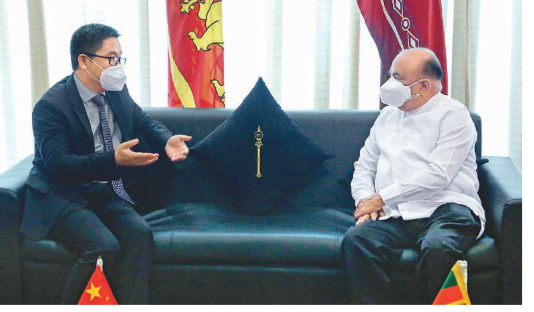
சீன மக்கள் குடியரசின் பிரதித்தூதுவர் ஹூவேய் சபாநாயகர் மஹிந்த யாப்பா அபேவர்தனவை நேற்று (08) சந்தித்தார். பாராளுமன்ற கட்டட்தொகுதியில் இடம்பெற்ற இந்த சந்திப்பில் சீனா மற்றும் இலங்கைக்கிடையிலான இருதரப்பு உறவுகள் தொடர்பில் கலந்துரையாடப்பட்டன.