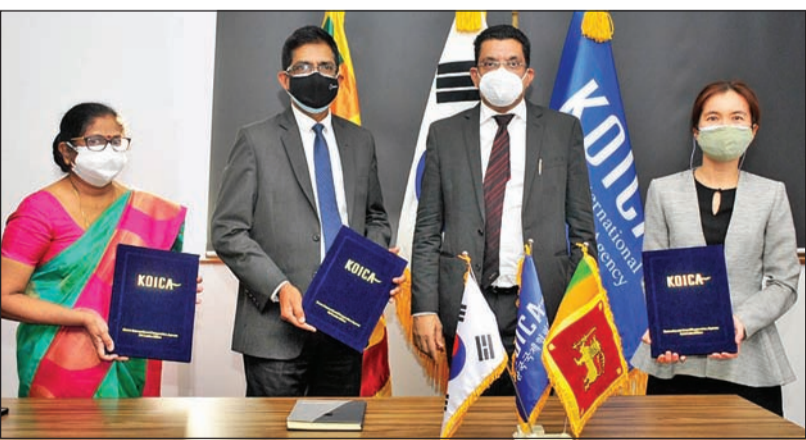
அரச இரசாயன பகுப்பாய்வு திணைக்களத்தின் வசதிகளை அதிகரிப்பதற்கும் மற்றும் திறன் அபிவிருத்திக்கும் உதவிகளை பெற்றுக் கொடுப்பதற்கான ஒப்பந்த மொன்று கொரிய சர்வதேச