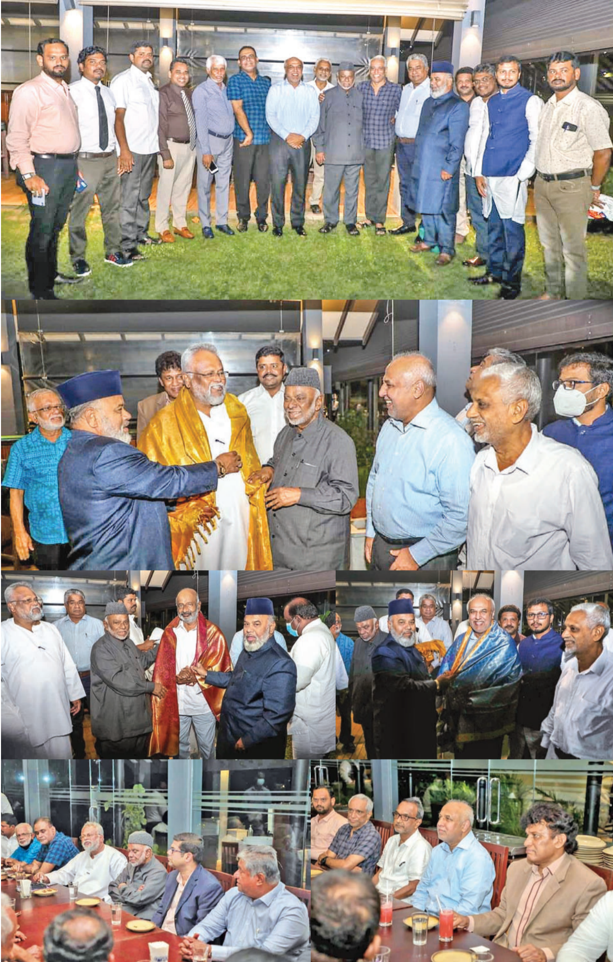
இலங்கை வந்துள்ள இந்திய யூனியன் முஸ்லிம் லீக் தலைவர் பேராசிரியர் காதர் மொகிதீன் உள்ளிட்ட குழுவினரை கௌரவிக்கும் முகமாக ஸ்ரீலங்கா முஸ்லிம் காங்கிரஸ் தலைவர் ரஷித் ஹக்கீம் ஏற்பாடு செய்திருந்த இராப்போசன நிகழ்வு நேற்று முன்தினம் போட்டூர்ஸ் எட்ஜ் ஹோட்டலில் நடைபெற்றது. இந்நிகழ்வில் அமைச்சர் டக்ளஸ் தேவானந்தா, இந்திய உயர்ஸ்தானிக துணைத் தூதுவர், தமிழ் மற்றும் முஸ்லிம் பாராளுமன்ற உறுப்பினர்கள் உள்ளிட்டோர் கலந்துகொண்டனர்.