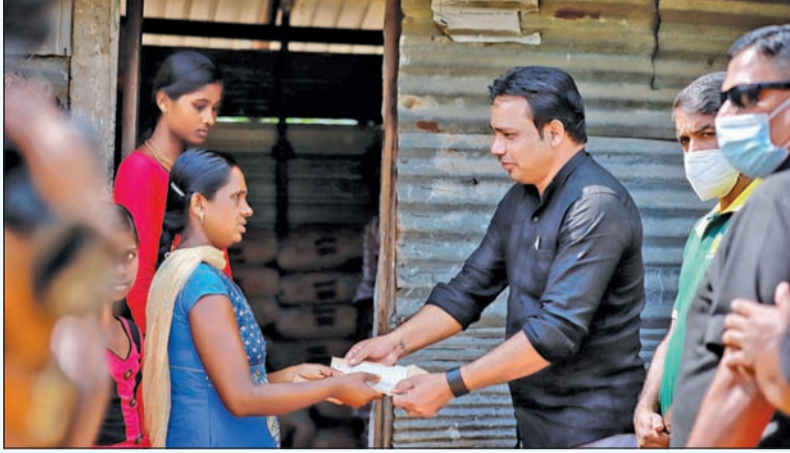
சிறுமியின் உயிர் இழப்பு பிரதேச மக்கள் மத்தியில் பாரிய சோகத்தை ஆழ்த்தியது. அந்த சந்தர்ப்பத்தில் சம்பவ இடத்துக்கு விரைந்த