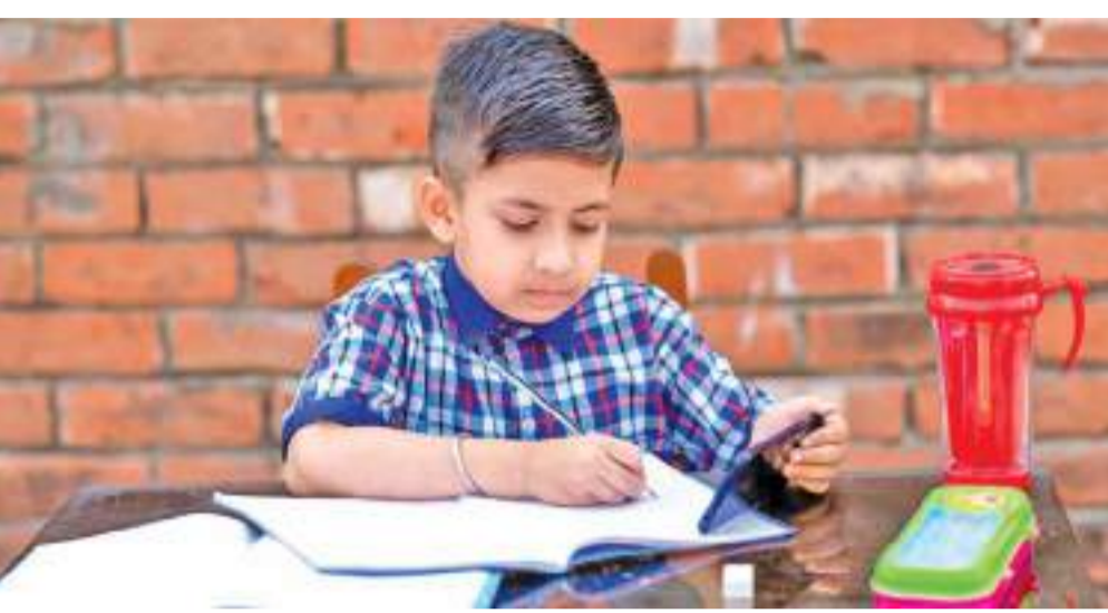
அந்த வகையில் இலங்கையில் பல்வேறு பிரதேசங்களிலும் பின்புலக் கிராமங்களில் தொலைபேசி சமிக்ஞை காணப்படாமையினால் மாணவர்களும் பெற்றோர்களும் மரங்களிலும் மலை உச்சிகளிலும் சமிக்ஞைகளை தேடி அவைந்த காட்சிகளை நாம் ஊடகங்களில் கடந்த காலத்தில் காணக் கூடியதாக இருந்தது. தொழில்நுட்ப அறிவைத் தேடி மாணவர் சமூகம் இணையத்தளத்தில் புகுந்த போதும், அதன் எதிர்மறையான தாக்கம் மாணவர் மத்தியில் பெரும் பாடகமான விளைவுகளை ஏற்படுத்தியுள்ளது.

றத்தில் 38 வீதமாகவும் கிராமப்புறத்தில் 18 வீதமாகவும் மலையகப் பகுதியில் 46 வீதமாகவும் காணப்படுகிறது. அதேவேளை இணையத்தளங்களை பயன்படுத்தும் குடும்பங்களின் சதவீதம் 30.3. அவற்றில் நகர்ப்புறத்தில் 47.4 வீதமாகவும் கிராமப்புறத்தில் 27.5 வீதமாகவும் மலையகப் பகுதியில் 12.2 வீதமாகவும் காணப்படுகிறது. தொலைக்காட்சி வசதி உள்ள குடும்பங்கள் 90 வீதமாகும். வானொலி வசதிகள் கொண்ட குடும்பங்கள் சுமார் 63 வீதமும் உள்ளதாக புள்ளிவிபரங்கள் உறுதிப்படுத்துகின்றன. ஆனாலும் இணையத்தளக் கல்வி போலவே தொலைக்காட்சி, வானொலி சேவைகளும் ஒட்டுமொத்த இலங்கையையும் தழுவவில்லை என்பது குறிப்பிடத்தக்கது.