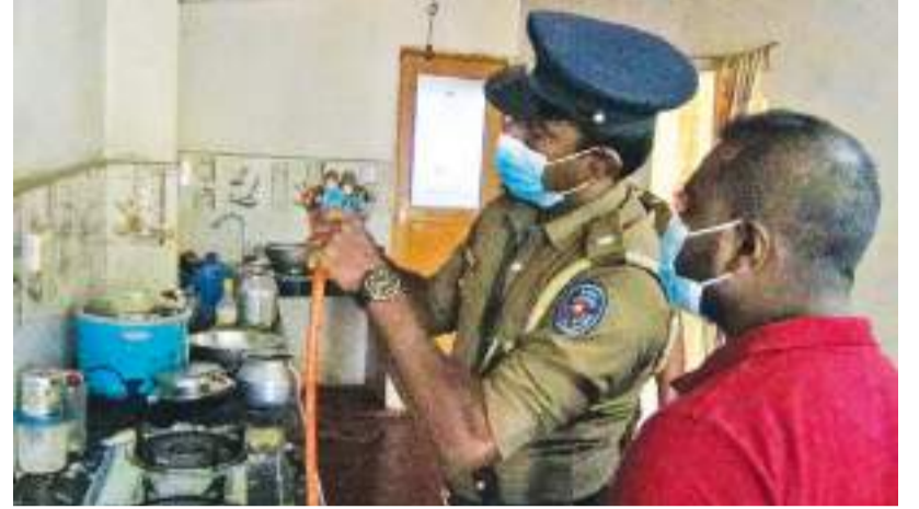
ஹற்றன் விசேட, பலாங்கொடை, தலவாக்கலை குறாப் திருபர்கள்

பலாங்கொடை பொலிஸ் பிரிவுக்குட்பட்ட தெலிகல்தலாவை மறைவந்த பகுதியில் வீடொன்றில் சமையல் எரிவாயு அடுப்பில் வெடிப்புச் சம்பவமொன்று நேற்று முன்தினம் இடம்பெற்றுள்ளதாக பொலிஸார் தெரிவித்தனர். அதிகாலையில் வீட்டில் உள்ள பெண் எரிவாயு அடுப்பை பற்றவைக்க முற்பட்ட போதே வெடித்து சேதமடைந்துள்ளது. இச்சம்பவத்தினால் எவருக்கும் பாதிப்பு ஏற்படவில்லை. கடந்த மூன்று தினங்களுக்கு முன்னர் எரிவாயு சிலிண்டர் வாங்கப்பட்டுள்ளதாக சம்பந்தப்பட்ட வீட்டின் உரிமையாளர் தெரிவித்தார்.