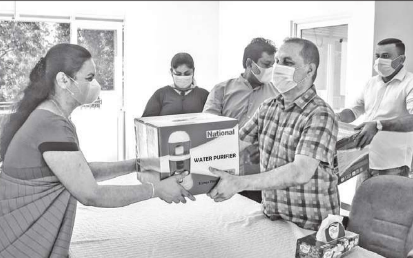
தங்காலை பிரதேசத்திலுள்ள முன்பள்ளிப் பாடசாலைகளுக்கு நீர்க்கதிப்பை உபகரணங்கள் வழங்கப்பட்டன. இதன்போது சுற்றாடல் அமைச்சர் மஹிந்த அமரவீர நீர்க்கதிப்பை உபகரணங்களை வழங்கி வைப்பதை படத்தில் காணலாம்.

உப விதிகள் பலவற்றில் நுளம்பு உற்பத்திக்கான வாழ்ப்பு உள்ளதாகவும் தெரிவித்துள்ளார். இது பற்றி உரிய நடவடிக்கை எடுக்க விரும்புகப்பட்டுள்ளதோடு, நுளம்பு உற்பத்தியாகும் இடங்களை அழித்து விடுமாறும் கேட்கப்பட்டுள்ளது. அடுத்த வரும் நாட்களில் நகரத்திலுள்ள நிறுவனங்கள் மற்றும் வீடுகள் கட்டடங்கள் அமைந்துள்ள பகுதிகள் பரிசோதனைக்கு உற்படுத்தப்பட உள்ளமையும் குறிப்பிடத்தக்கது.