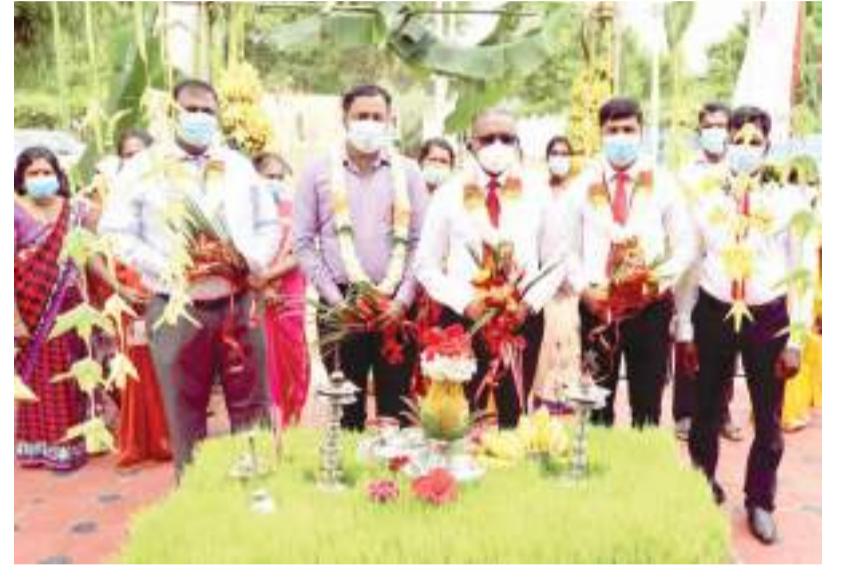
மாங்குளம் குறாப் நிருபர்