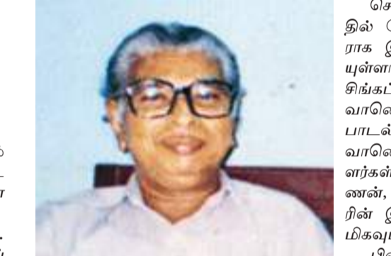
செய்யும் விதமாக தனது இசையை வெளிப்படுத்திய மேதையும் அவரா வார்.

இவருக்கு ஓராண்டு முத்தவர். தமிழகத்திலேயே கர்நாடக இசை பயின்று இசைமணி பட்டம் பெற்ற முஸ்லிம் இவர் ஒருவரே. இராஜா அண்ணாமலை மன்றத்தில் 'இசைச்செல்வர்' பட்டமும் பெற்றுள்ளார். சென்னை பல்லாவரத்தில் உள்ள தமது இல்லத்திற்கு 'இசையிலம்' என்ற பெயர் வைத்தவர். காயிதேமில்லத் மீது அளப்பரிய அன்பு கொண்ட