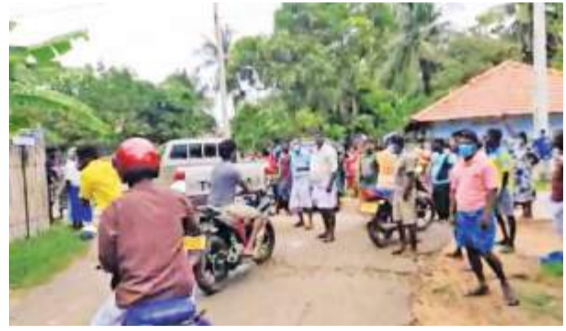
அளவிடுவதற்காக சென்றிருந்த மக்கள் கும் எதிர்ப்பினை வெளி

குறித்த பகுதிக்கு வனவளத்திணைக்களத்தினர் காணிகளை