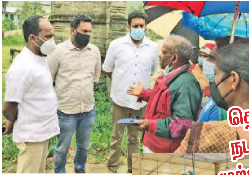
ஹற்றன் விசேட, ஹற்றன் சுழற்சி, தலவாக்கலை குறாப் திருபர்கள்

அக்கரப்பத்தனை பெருந்தோட்ட கம்பனிக்கு கீழ் இயங்கும் 12 தோட்டங்களை கொண்ட 42 பிரிவுகளை சேர்ந்த தோட்டத் தொழிலாளர்கள் நேற்று (13.12.2021) தொழிலுக்குச் செல்லாமல் பணிப்புகிஷ்கரிப்பில் ஈடுபட்டனர். இதற்கு கட்சி பேதமின்றி அனைவரும் பணிப்புகிஷ்கரிப்புக்கு ஒத்துழைப்பு வழங்கினர். தொழிலாளர்களுக்கு வழங்குவதாக வாக்குறுதி வழங்கப்பட்ட ஆயிரம் ரூபாய் சம்பளம் பரிசீலனை செய்ய இடம்பெற்றதாகவும், தற்போது தேயிலை மலைகள் காடாகி கிடப்பதால் 20 கிலோ