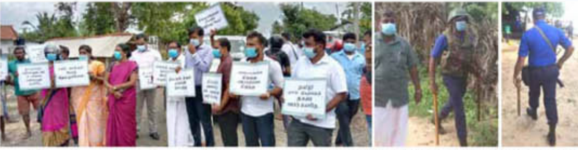
யாழ்ப்பாணம் மாதகல் கிழக்கு பகுதியில் கடற்படையினரின் தேவைக்காக தனியார் காணிகளை ஆக்கிரமிக்க

நேற்று எடுக்கப்பட்ட முயற்சிக்கு எதிர்ப்புத் தெரிவித்த காணி உரிமையாளர்களை படம் பிடித்தும் கொட்டன் பொல்லுகளைக் காட்டியும் கடற்படையினர் அச்சுறுத்தினர். போராட்டத்தில் போது அங்கிருந்த கடற்படை சிப்பாய் ஒருவர் போராட்டத்தில் ஈடுபட்ட பெண்களை படம்பிடித்து அச்சுறுத்தும் விதத்தில் செயற்பட்டார். இதேவேளை அங்கிருந்த புலனாய்வாளர் ஒருவர், போராட்டத்தில் ஈடுபட்ட பெண்கள் மீது கை காட்டி, மிரட்டி அச்சுறுத்தல் விடுத்தார். மேலும் ஒரு கடற்படை சிப்பாய்