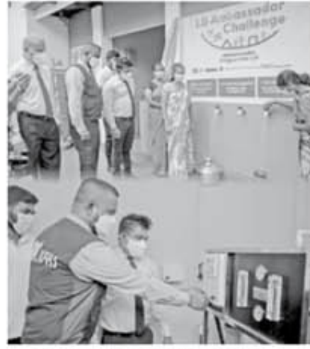
நிறைவேற்ற மக்களுக்கு சுத்தமான குடிநீர் கிடைத்துள்ளமையினால் கிராம மக்கள் பெரும் மகிழ்ச்சியில் உள்ளனர். 'LG கிராமத்தை கட்டியெழுப்பும் பிரமுகர்' திட்டத்தின் மூலம் அமுல்படுத்தப்படும் ஏனைய திட்டங்களான பாலக் கொடை ஊந்தகிரிய கிராமத்தில் 'வளமான தலைமுறையை

அவ்வாறு வழங்கப்பட்ட வாய்ப்புகளின் மூலம் 2021 ஆம் ஆண்டில் 4 திட்டங்கள் தேர்ந்தெடுக்கப்பட்டு பூர்த்தி செய்யப்பட்டுள்ள நிலையில், பூர்த்தி செய்யப்பட்ட திட்டங்களில் முதலாவது திட்டத்தை மக்கள் மயப்படுத்தும் விழா 16.11.2021 ஆம் திகதி வவுனியா தரணிகுளத்தில் இடம்பெற்றது. இத்திட்டமானது வவுனியா தரணிகுளம் கிராமத்தில் வசிக்கும் 610 குடும்பங்களுக்கு சுத்தமான குடிநீரை வழங்கும் உயிர் வாழ்வதற்கு ஒரு துளி நீர் என்ற கருத்துடன் திட்டத்தின் கீழ் உருவாக்கப்பட்ட குடிநீர் சுத்திகரிப்பு மற்றும் வடிகட்டுதல் திட்டமாகும். இந்த பிரதேசத்தின் மக்கள் இதுவரை காலம் குடிநீர் தேவைக்காக பயன்படுத்திய கிணற்றை சுத்தம் செய்து சீரமைத்து அந்த கிணற்றிலிருந்து நீரை சுத்திகரிப்பு செய்வதற்கான சுழற்சி சுத்திகரிப்பு இயந்திரம் நிறுவப்பட்டது. சுத்தமற்ற குடிநீர் இல்லாத காரணத்தினால் சிறுநீரக நோயினால் பாதிக்கப்பட்டுள்ளனர். இத்திட்டம்