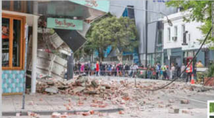
இந்தோனேஷியாவில் நேற்று செவ்வாய்க்கிழமை காலை பயங்கர நிலநடுக்கம் ஏற்பட்டது. இது ரிச்டர் அளவில் 7.5 ஆக பதிவாகியுள்ளது. மேலும் இந்த நிலநடுக்கத்தால் கனாமி அலை உருவாக வாய்ப்புள்ளதாக எச்சரிக்கை விடுக்கப்பட்டுள்ளது. இந்தோனேஷியாவில் நேற்றுக் காலை பயங்கர நிலநடுக்கம் ஏற்பட்டது. மவுடர் என்ற இடத்தில் இருந்து 95 கி.மீ. வடக்கே கடல்பகுதியில்

இந்த நிலநடுக்கம் ஏற்பட்டுள்ளது. இதன் காரணமாக நாட்டின் பல இடங்களில் வீடுகள் குலங்கொண்டன. இதனால் மக்கள் அலறியடித்துக் கொண்டு இருப்பிடத்தை விட்டு வெளியேறினர். ரிச்டர் அளவில் 7.5 ஆக பதிவாகியுள்ளது. இதனால், இந்தோனேஷியாவில் கனாமி அலை உருவாகலாம் என பகடிக் கனாமி மையம் எச்சரிக்கை விடுத்துள்ளது.