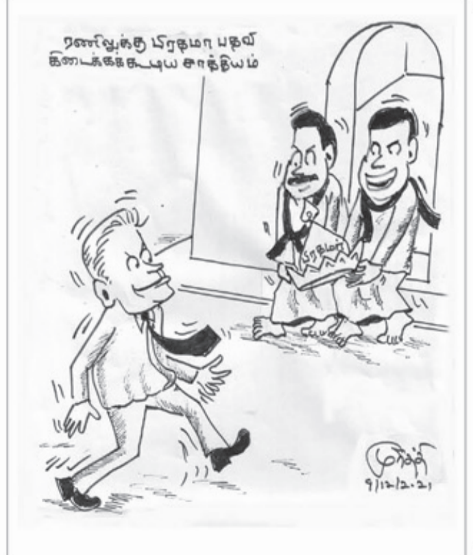
ரணவீக்து டீர்துமே பதவ் கடைக்ககட்டிய சாந்தியம்