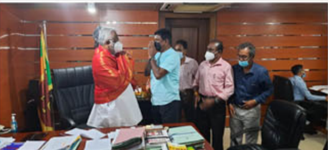
கோரிக்கை முன்வைத்துள்ளனர். இறங்குதுறை போன்ற விடயங்கள் சம்பந்தப்பட்ட தரப்புக்களுடன் தொடர்பாக சம்பந்தப்பட்ட அதிகாரிகளுடன் கலந்துரையாடி நடவடிக்கை மேற்கொள்ளப்படும் எனவும் தெரிவித்துள்ளமை குறிப்பிடத்தக்கது. (75)