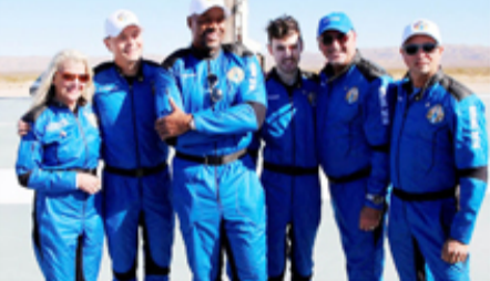
விண்வெளி சென்ற முதல் அமெரிக்க வீரரான அலென் செப்பர்ட்டின் மகள் உட்பட 6 பேர் கொண்ட குழு ஜெப் பெசாஸின் ப்ளூ ஆர்ஜின் நிறுவன

ராக்கெட்டில் விண்வெளி சுற்றுப்பயணம் மேற்கொண்டது. மேற்கு டெக்ஸாசில் உள்ள வான் ஹார்ன் ஏவுகணத்தில் இருந்து கிளம்பிய ராக்கெட்டில் 6 பேர் பயணம் செய்தனர். பூமியில் இருந்து 106 கிலோ மீற்றர் தொலைவில் சுமார் 10 நிமிடங்கள் விண்வெளியில் பயணித்தனர். காஹன் கோடு அருகில் சில நிமிடங்கள் ஈர்ப்பு விசையை இழந்து மிதந்தனர். தொடர்ந்து விண்கல கேப் சியூல் பத்திரமாக தரையிறக்கப்பட்டது.