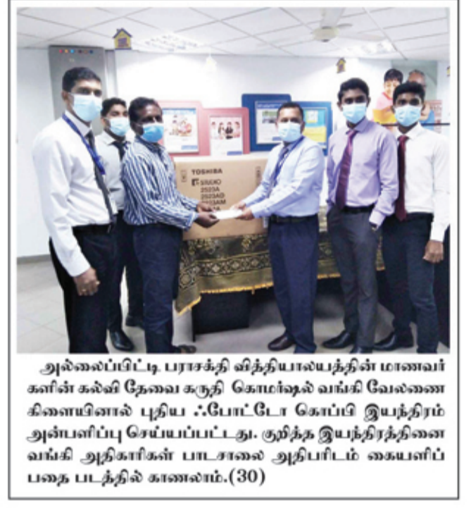
அல்லைப்பிட்டி பராசக்தி வித்தியாலயத்தின் மாணவர்களின் கல்வி தேவை கருதி கொம்ஷல் வங்கி வேல்களை கிளைமீனால் புதிய ஃபோட்டோ கோப்பி இயந்திரம் அன்பளிப்பு செய்யப்பட்டது. குறித்த இயந்திரத்தை வங்கி அதிகாரிகள் பாடசாலை அறிவிடம் கையளிப்பதை படத்தில் காணலாம்.(30)

இவ் வீதி புனரமைப்பு செய்யப்பட்டு ஒரு வருடமே ஆகின்ற நிலையில் முள்ளி ஐயங்கண்டி மயானத்துக்கு அருகாமையில் உள்ள பாலத்துக்கு அருகாமையிலேயே வெடிப்பு ஏற்பட்டு வீதி கீழ் இறங்கியுள்ளது. (44)