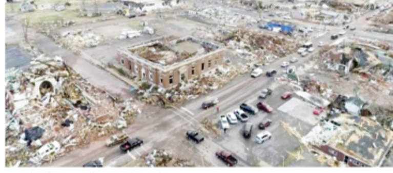
அமெரிக்கா - கென்டகி மாநிலத்தில் டெனாடோ சூறாவளியினால் சுமார் 80இற்கும் மேற்பட்டோர் உயிரிழந்திருக்கின்றனர். மாநில வரலாற்றில் மிகவும் மோசமான சூறாவளி இதுவாகும் என மாநில ஆளுநர் குறிப்பிட்டுள்ளார். இந்த சூறாவளி காரணமாக,

மாநிலத்தின் பல பாகங்களில், கடுமையான சேதம் ஏற்பட்டுள்ளதால், மக்கள் பெரிதும் பாதிக்கப்பட்டுள்ளதாக தெரிவிக்கப்பட்டுள்ளது.