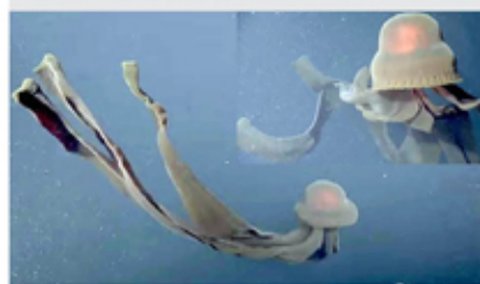
மிகவும் அரிய வகை பாண்டம் ஜெல்லி மீன்கள் அமெரிக்க கடற்பகுதியில் தென்பட்டிருக்கின்றது. கடந்த 1899ஆம் ஆண்டு பார்க்கப்பட்ட இந்த வகை ஜெல்லி மீன்கள் 33 அடி

நீள கால் போன்ற இழைகளுடன் பிரமாண்டமாகக் காட்சியளிக்கும், தற்போது கலிபோர்னியாவில் உள்ள மாண்டரே வளைகுடாவின் அதிக ஆழத்தில் படம் பிடிக்கப்பட்டுள்ளது. கிட்டத்தட்ட 3 ஆயிரத்து 200 அடி ஆழத்தில் வலம் வந்த பாண்டம் ஜெல்லி மீனை ரோபோ உதவியுடன் ஆய்வாளர்கள் படம் பிடித்துள்ளனர்.