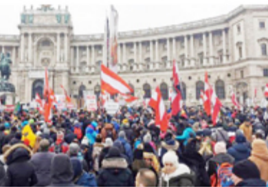
கோஷத்தை முன்வைத்து போராட்டங்கள் இடம்பெறுகின்றன. எவருக்கும் வலுக்கட்டாயமாக தடுப்பூசி போடப்பட மாட்டாது என அரசாங்கம் கூறினாலும் அதை மறுப்பவர்களுக்கு 4,000 டொலர் வரை அபராதம் விதிக்கப்படும் என அறிவிக்கப்பட்டுள்ளது.

கடந்த பெப்ரவரி முதல் கொரோனா தடுப்பூசியை கட்டாயமாக்குவதற்கான அரசாங்கத்தின் முடிவுக்கு எதிராக எதிர்க்கட்சிகளுடன் ஒன்றிணைந்து மக்கள் போராடி வருகின்றனர். தடுப்பூசி போட வேண்டுமா என்பதை தாங்களாகவே தீர்மானிக்கும் சுதந்திரம் மக்களுக்கு இருக்க வேண்டும் என்ற