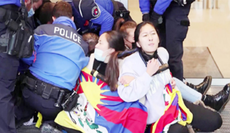
சுவிட்சர்லாந்தில் உள்ள சர்வதேச ஒலிம்பிக் கொமிட்டி அலுவலகம் முன்பாக போராட்டம் நடத்திய திபெத்திய மாணவர்கள் பலவந்தமாக வெளியேற்றப்பட்டுள்ளதாக சர்வதேச செய்திகள்

விட்டது விட்டுள்ளதாகவும், அதனால் உலக நாடுகள் குளிர்கால ஒலிம்பிக் போட்டியை புறக்கணிக்க வேண்டும் என மாணவர்கள் தெரிவித்தனர்.