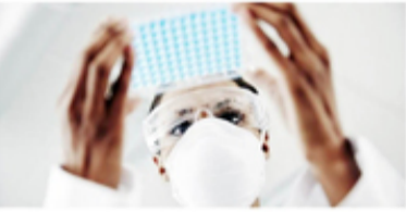
பிரித்தானியாவில் ஓமிக்ரான் மாறுபாடுள்ள 633 நோயாளிகள் கடந்த சனிக்கிழமை அடையாளம் காணப்பட்டிருப்பதாக அறிவிக்கப்பட்டுள்ளது.

அத்தோடு அவர்களுடன் சேர்த்து கடந்த 24 மணிநேரத்தில் 54,073 புதிய நோயாளிகள் அடையாளம் காணப்பட்டுள்ளதாக பிரித்தானியா அறிவித்துள்ளது. இருப்பினும் ஓமிக்ரான் மாறுபாடு உறுதியான நோயா