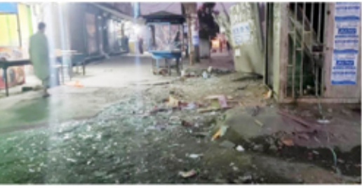
ஆப்கானிஸ்தான் - காபூல் இரு இடங்களில் பாரிய குண்டு வெடிப்புச் சம்பவங்கள் பாதிகாயியுள்ளதுடன்,

இருவர் கொல்லப்பட்டு 4 பேர் காயமடைந்துள்ளதாக தலிபான் அரசாங்க தகவல்கள் தெரிவிக்கின்றன.