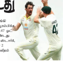
முதல் பந்தில் விகிதம்விரைத் இழந்த இங்கிலாந்து 147 ஓட்டங்களுக்கு சுருண்டது.

இந்தப் போட்டியில் முதலில் தடுப்பெடுத்த இங்கிலாந்து கமரிமீலா கிழை, ஆட்டின் முதல் பந்திலேயே ஸ்டாட் விகிதம்விரைத் கைப்பற்றி சாதித்தார். தோர் பரின்ஸ் முதல் பந்தில் ஓட்டமெய்யே பெறாமல் வெளியே