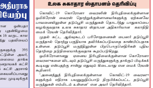
உலக சுகாதார ஸ்தாபனம் தெரிவிப்பு