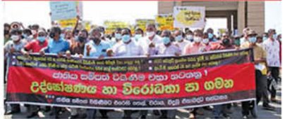
(இராஜாங்க அமைச்சர்) யுகதளவி மின்னிலையத்தின் 40 சதவீத பங்குகளை அமெரிக்க திறுவனத்துக்கு வழங்க அரசாங்கம் முன்னெடுத்துள்ள தீர்மானத்துக்கு எதிர்ப்பு தெரிவித்து துறைமுகம் பெற்றோலியம், மின்சாரத்துறை ஆகிய துறைகளின்