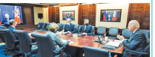
வித்து மேற்குவின் கவனத்தை ஈர்க்கத் திட்டமிட்டுள்ளார் என்பது குறித்து ஐக்கிய உலக விட்டுவட்டாரகல் அமெரிக்க அதிகாரிகள் தெரிவிக்கின்றனர். உக்ரேனிய பிரதீபிக்குத் தன் 70,000 ரஷ்யப் படைமீளினர் தலைவராக உள்ளார் என்பது பிரதீபிக்குத் தினசரி மேலதிக படைமீளினர் ஆய்நகலும் வந்த தயாராக வருவதாக தெரிவித்ததாக அமெரிக்க கூட்டம் ஆம்மீளான போது ஜோ பைட்டுக்கு புட்டன் வாழ்த்துகளைத் தெரிவித்தார்.

உக்ரேனில் மேற்கொள்ளப்படும் ஆக்கிரமிப்பு நடவடிக்கைகள் ரஷ்ய ஜனாதிபதிக்கு எதிராக கருமீ பொருளாதார தளைக் விகிதம்விரைத் இணையோர் லுள்ள ரஷ்யப் படைமீளினர் இணையோர் மேட்டோ படைமீளினர் தலைவராக உள்ளதாக அமெரிக்க ஜனாதிபதி ஜோ பைடன் ரஷ்ய ஜனாதிபதி விளாடியூர் புட்டனுக்கு அமெரிக்க தேர்ப்படி நேற்று முன்தினம் ஸென் வாங்கிழமை இடம்பெற்று காணொளித் தொடர்பாட்டில் மூலமான உச்சிமநாறும் உச்சிமநாறும் விடுத்தனர். 7 வருடங்களுக்கு முன்பு உக்ரேனிய திரிமியா பிரதீபிக்கு உக்ரேனிய தன் லுடன் இணைத்துக் கொண்ட போது எடுக்கப்பட்ட நடவடிக்கை அப்பால் நடவடிக்கை எடுக்கப்படும் என அவர் கூறினார். மேற்படி சந்திப்பின் போது புட்டன் தனது இறுதியான நோக்கம் குறித்து தனையும் குறிப்பிட்டுக் கூறவில்லை எனவும் அவர் எதிர்த்தும் வருட ஆம் பந்தில் தெருக்கடியெண்ணைத் தோற்று