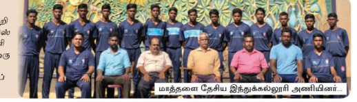
மாத் தளை தேசிய இணையோர் அணிமீயர்.