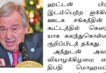
ஐக்கிய நாடுகள் செயலாளர் நாயகம் அந்தோனிஸோ குட்டரெஸ் ஏற்கனவே கொவிட்-19 கொள்கை வரைல் தொற்றுக்குள்ளான ஒரு உத்தியோகத்தின் குடும்பம் கொவிட்-19 கொண்டு கண்டறியப்பட்டதையடுத்து அவர் தனிமைப்படுத்தப்பட்டுள்ளதாக இராஜதிரை வட்டாரங்கள் தெரிவிக்கின்றன.

மொத்தம் 50 ஓவர்களில் அணியை விகிதம் 54 ஓட்டங்களால் மாதிரிமே பெற்றுக்கொண்டது. இதனையடுத்து வெற்றி இலக்கைத் தூக்கிய மரூில் ஸ்டெட்லா அணி வெற்றி பெற்றது. 55 ஓட்டங்களால் பெற்று வெற்றிபெற்றது.