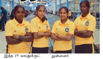
இந்த 19 வயதுக்குட்பட்ட மகளிர் கால்பந்து அணிக் கு நடு பூலாவும் உள்ள பாடசாலைகளில் இருந்து விரைத்தளைகள் தெரிவு செய்யப்பட்ட நிலையில் 23 பேர் அடங்கிய இலங்கை குழந்தியர் நான்கு வடக்கு விரைக்களை வாய்ப்பெய் பெற்றுள்ளனர். யாழ்ப்பாணம் தெல் லிப்பெழு மகாலா கல்சூரியில் விரைக்களை இணையோர் ஜோகிதா தெரிவு செய்யப்பட்ட நிலையில் 23 பேர் அடங்கிய இலங்கை குழந்தியர் நான்கு வடக்கு விரைக்களை வாய்ப்பெய் பெற்றுள்ளனர்.

எல் ஜே பிரதாத பங்காளத்தெவில் எதிர்த்து 11ஆம் திகதி ஆரம்பமாகவுள்ள 19 வயதுக்குட்பட்ட மகளிர்களை தெற்காசியக் கால்பந்தாட்ட சம்பந்திப் பங்கேற்கும் தோட்டில் பங்கேற்கும். இலங்கை இணையோர் மகளிர் அணி நேற்று பங்காளத்தெவு புறப்பட்டது. மொத்தம் 50 நாடுகள் மீறும்பெறும் இணையே மாத இலங்கை அணி முதல் நாளின் தளை முதல் போட்டியில் பூட்டான் அணியை எதிர்த்தாவள் எது.