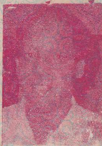
கிறிசு ஹானி (Chris Hani)