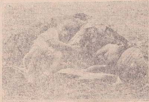
போர்ச்சுழலை எடுத்தியம்பும் ஒரு காட்சி

மிடையில் நடைபெற்ற குழப்பங்களில் போது பல்லாயிரக்கணக்கான துச்சி இனமக்கள் கொல்லப்பட்டதோடு அவர்களில் 150,000 மக்கள் அயல் நாடுகளான உகண்டா, தான்ஷானியா, புறண்டி, ஷயர் ஆகிய நாடுகளுக்கு ஏதிலிகளாக தப்பிச்சென்றனர். குட்டுஸ்களின் தலைமையில் ஆரம்பிக்கப்பட்ட 'சமூகப் புரட்சி'யானது ஆபிரிக்காவில் பழமையான ஏதிலிச் சிக்கலாக முடிந்தது.