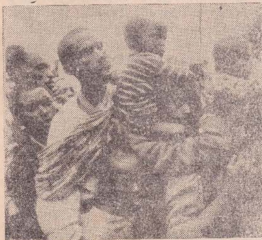
அகதிகளாக துத்சிசு மக்கள் தான்ஷானியாவிற்குச் செல்வதைக் காணலாம்

பட்டது. 1993 ஆம் ஆண்டு யூன் மாதத்தில் நடைபெற்ற தேர் தலை குட்டுஸ்களின் கட்டுப்பாட்டிலுள்ள சனநாயக முன்னணி வெற்றிபெற்றது. ஆனால் துத்சிசுகளின் கட்டுப்பாட்டிலுள்ள படையணி, அதிகாரத்தில் தங்களைது கொடுமான ஏகீபாக உரிமையை விடாது வைத்திருக்கும் மூர்க்கமான முயற்சியில் புதிதாகத் தெரிவு செய்யப்பட்ட குட்டுஸ் இனத்தைச் சேர்ந்த சனாதபதி மெக்ஸியோர் நித்தாயேயை 1993 ஆம் ஆண்டு நவம்பர் மாதத்தில் கொலை செய்தது இது இரத்த ஆறு ஓடும் ஆன்னொரு வெறியாட்டத்திற்கு வழிவகுத்தது.