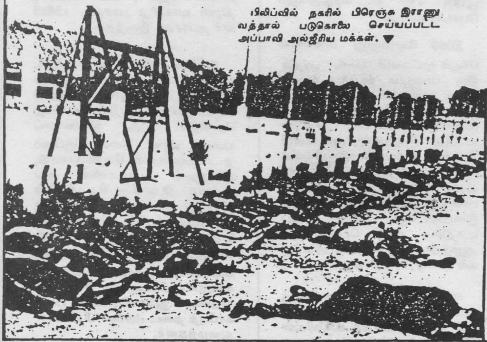
பிலிப்பீன்சில் நகரில் பிரெஞ்சு இராணுவத்தால் படுகொலை செய்யப்பட்ட அப்பாவி அல்ஜீரிய மக்கள். ▼

3. கைப்பற்றப்பட்ட கெரில்லாப் போர் வீரர்களுக்கு அவர்கள் செய்தது குறித்து என்றும், பிரெஞ்சு அரசுக்கு அவர்கள் விசுவாசமாக நடக்க வேண்டும் என்றும் மறுபோதனை (Re-education) அளிக்கப்பட்டது.