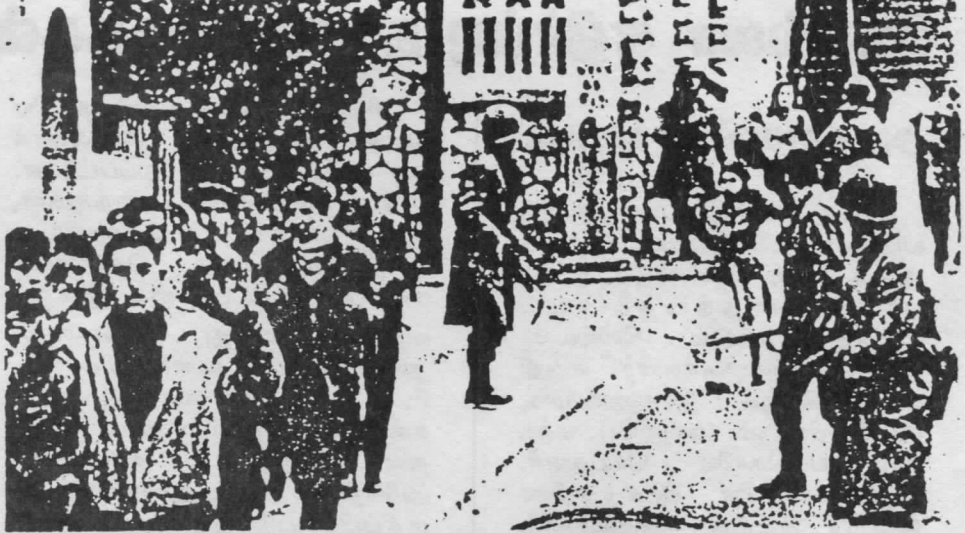
பிரெஞ்சு இராணுவம் அல்ஜீரிய இளைஞர்களை சுற்றி வளைத்துப் பிடிக்கிறது

எவராவது மின்னணுப்பைத் துண்டித்து உள் நுழைய முயன்றால், மின்னணுக்கக் கருவிகள் (Electronic devices) அண்மை