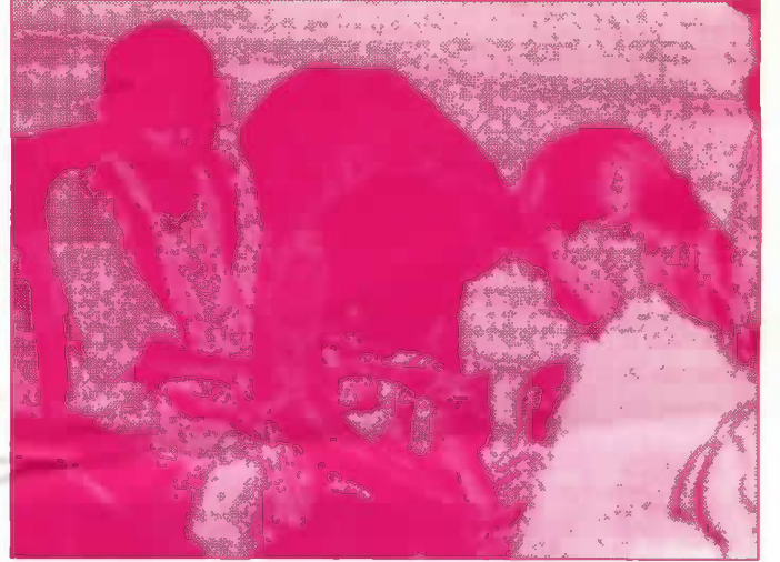
கால இழந்த பெண்பிள்ளைக்கு வெண்புறா நிறுவனத்தைச் சேர்ந்தவரால் செயற்கைக்கால் பொருத்தப்படுகின்றது. எம்.எஸ்.எவ்.பிரதிநிதி அதை பார்வையிடுகின்றார்.

இக்கடனுதவிமூலம் தமது பயிர்ச்செய்கை நடவடிக்கைகளை இவ்விவசாயிகள் விஸ்தரிக்கவுள்ளனர்.