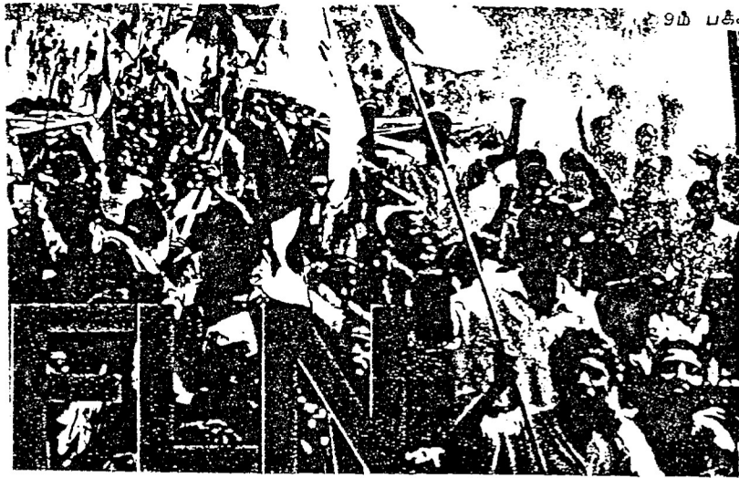
▲ விடுதலையின் பின் அல்லீரிய மக்களின் வெற்றி ஊர்வலம்.